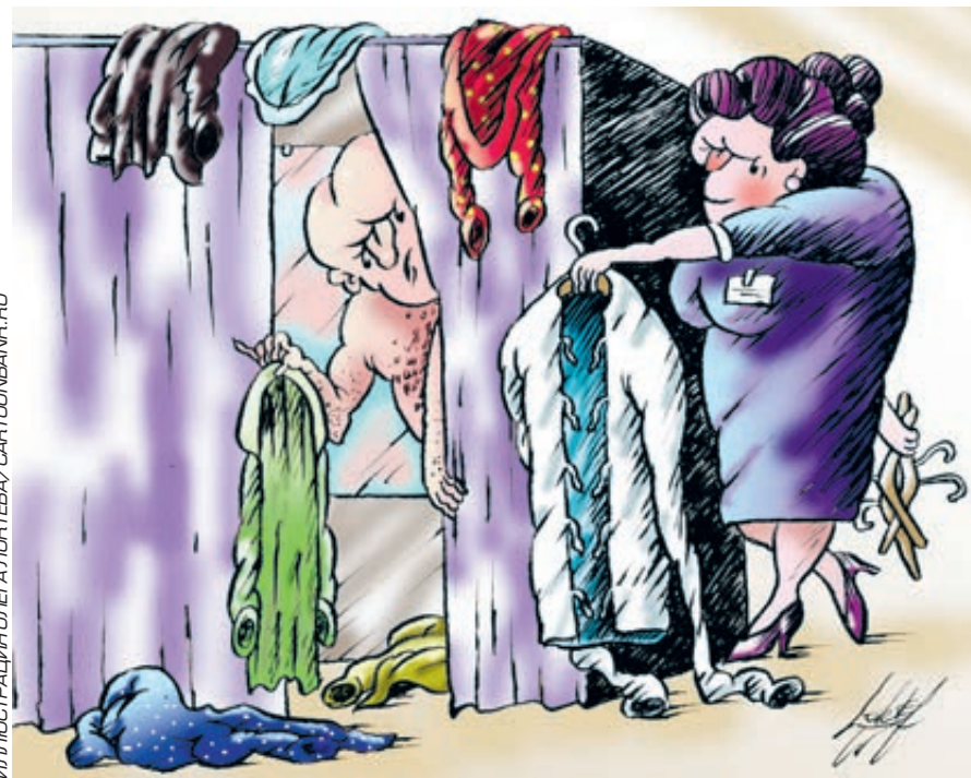
ИЛЛЮСТРАЦИЯ ОЛЕГА ЛОНТОВА/CARTOONBANK.RU

Логика покупателя проста: зачем покупать дороже то, что можно купить дешевле? Магазином же такие покупатели доставляют головную боль и убытки. Продавец-консультант старается, тратит свое рабочее время, а в конце диалога слышит: «Ну, я еще подумаю». Продажи падают, рентабельность снижается, содержать существующие в реальном мире магазины с каждым годом все накладнее.