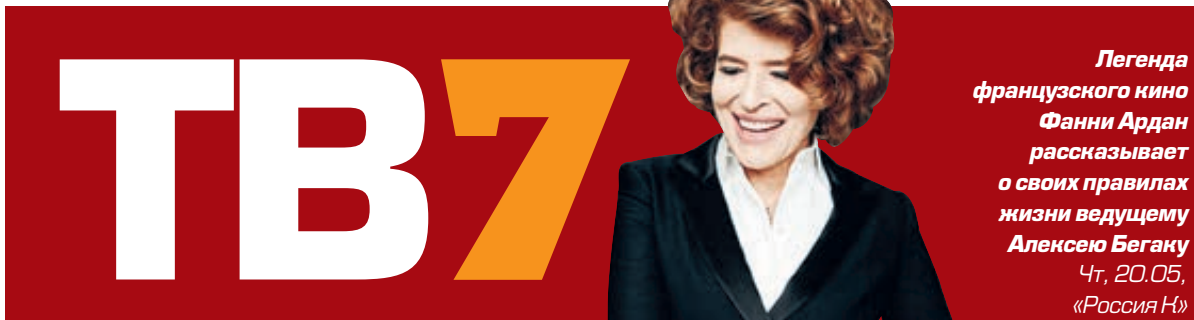
Легенда французского кино Фанни Ардан рассказывает о своих правилах жизни ведущему Алексею Бегуну