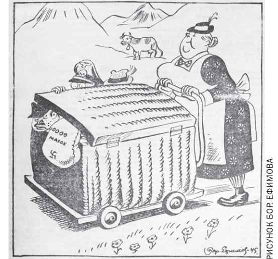
РИСУНОК БОР ЕФИМОВА

В этой маленькой корзине Есть предатель из Виши, Выклады немцев, Муссолини, Что угодно для души! Отделение Берлина? Рейхсквартиры филиал? Что за странная корзина, Кто ее упаковал? Сердобольная нейтралка, Не смущаясь, в пять минут, Пассажирам катафалка Предоставила приют. Не нашли нигде спасения – И корзина не спасет, Только суд им помещенье Подходящее найдет.