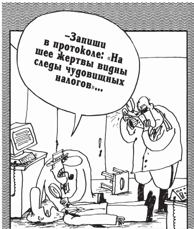
ИЛЛЮСТРАЦИЯ ВЯЧЕСЛАВА ШИЛОВА

Сегодня впервые в новейшей истории правительство взялось рассматривать «обратный документ» – об отмене собственных решений власти различных уровней, по которым отечественные предприниматели обложены десятками дополнительных различных платежей, считающихся «неналоговыми», то есть не за-