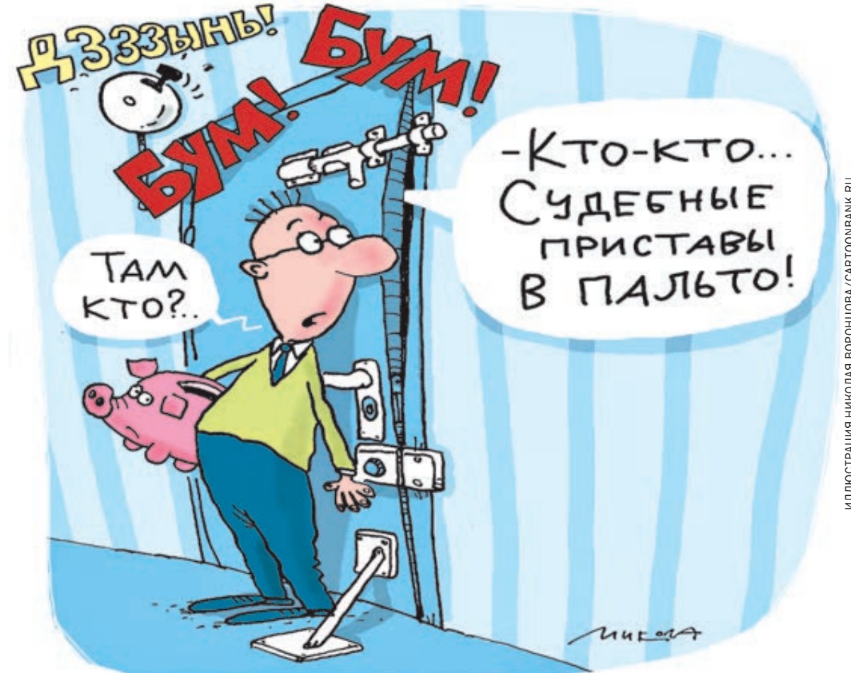
ИЛЛЮСТРАЦИЯ НИКОЛАЯ ВОРОНЦОВА/CARTOONBANK.RU

Статья 30 п. 17 Федерального закона «Об исполнительном производстве (ИП)» гласит: «Копия постановления судебного пристава-исполнителя о возбуждении исполнительного производства не позднее дня, следующего за днем вынесения указанного постановления, направляется взыскателю, должнику, а также в суд, другой орган или должностному лицу, выдавшему исполнительный документ». То есть, если за вами есть долг по неуплаченному штрафу, алиментам, кредиту и взыскатель долга обращается в ФССП, то судебный пристав