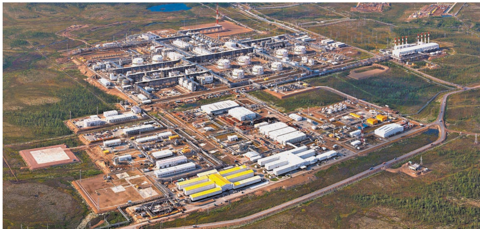
Ванкор – крупнейшее месторождение, открытое и введенное в эксплуатацию в России за последние 25 лет.