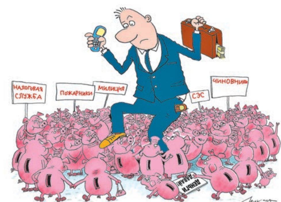
ИЛЛЮСТРАЦИЯ НИКОЛАЯ ВОРОНЦОВА/CARTOONBANK.RU

«Эта статья у нас используется крайне мало, хотя состав зачастую прослеживается, – признает замгенпрокурора. – Если чиновник не согласовывает бумаги в установленный срок, если требуют документы, которых по закону представлять не надо, из-за чего бизнес встает, – это повод задуматься. Но и следователи, и суды 169-й статьей не поль-