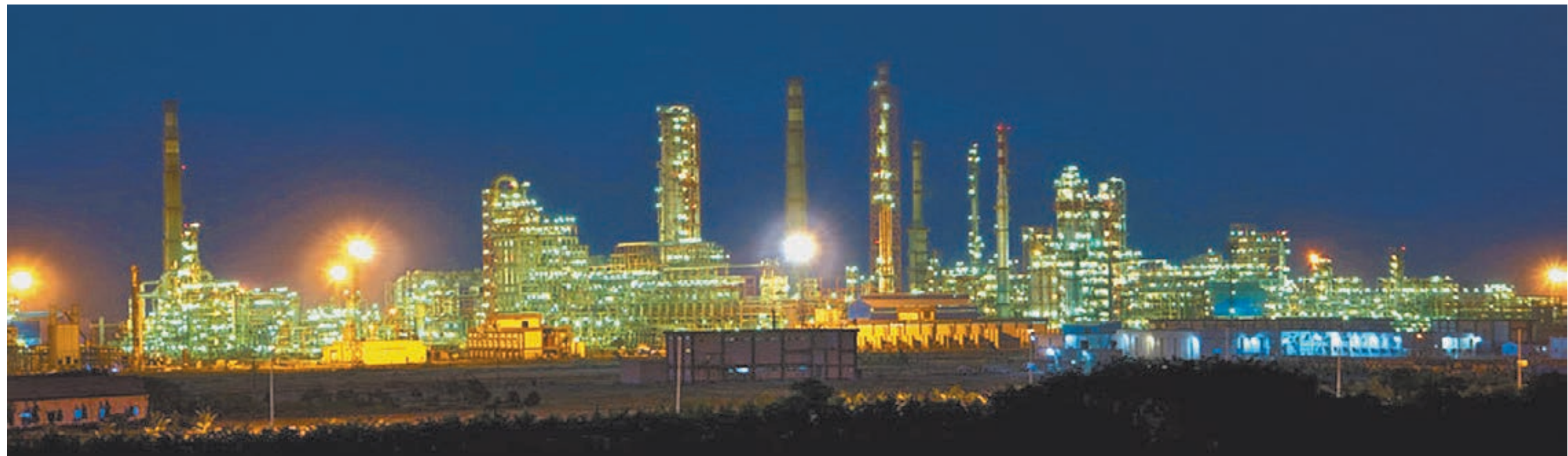
По объемам переработки Вадианский НПЗ является вторым в Индии, а по уровню технологической сложности входит в десятку лучших заводов мира.

«Роснефть» завоевывает новые плацдармы на быстрорастущем рынке