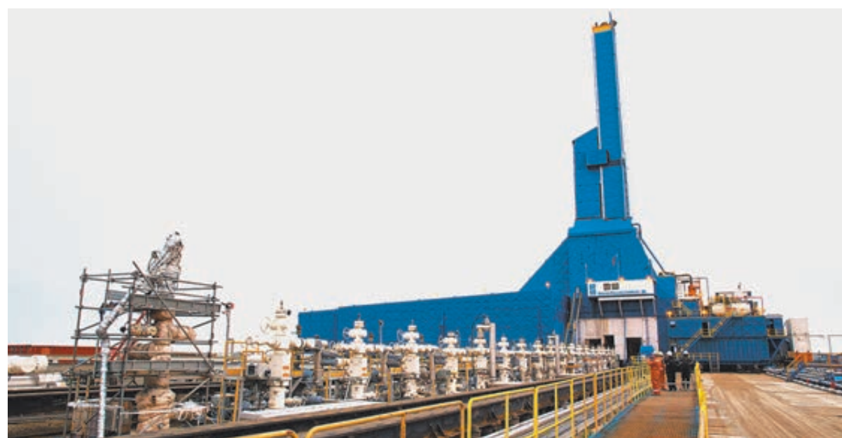
Наземная буровая установка «Ястреб» на месторождении Чайво проекта «Сахалин-1».