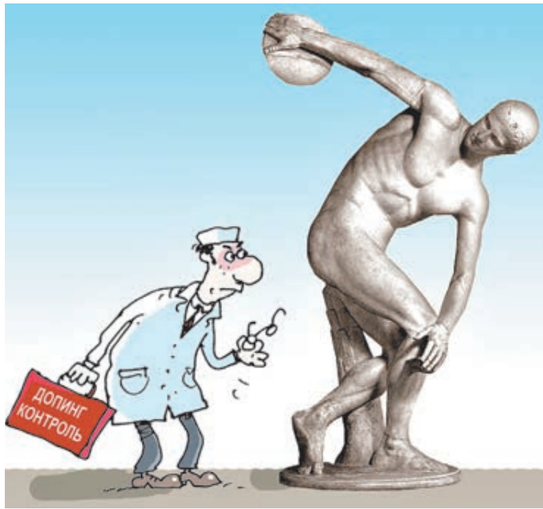
ИЛЛЮСТРАЦИЯ СЕРГЕЯ КОКАРЕВА/САРТОВАНК.RU

Мы, безусловно, больше других натерпелись от колдунов из ВАДА. Достаточно сказать, что Игры в Рио-2016 пропустила треть нашей олимпийской сборной и вся паралимпийская. Но теперь уже перед остальным миром встали вопросы: хороша ли система, требующая стольких жертв якобы ради благой цели, и в чьих интересах она работает? Скандал с россиянами всколыхнул тихую заводь лабораторий и чиновничьих кабинетов. «Может быть, сегодня по имиджу российского спорта и нанесен удар, но в целом Россия стала катализатором перемен. Все понимают, что нужны определенные стандарты антидопингового контроля», – резюмировал Виталий Мутко, с этой недели уже вице-премьер. Особо возмущительным выглядит принцип коллективной ответственности за прием допинга, проповедуемый ВАДА. Причем агентство собирается применять его и дальше. После осенних ки-