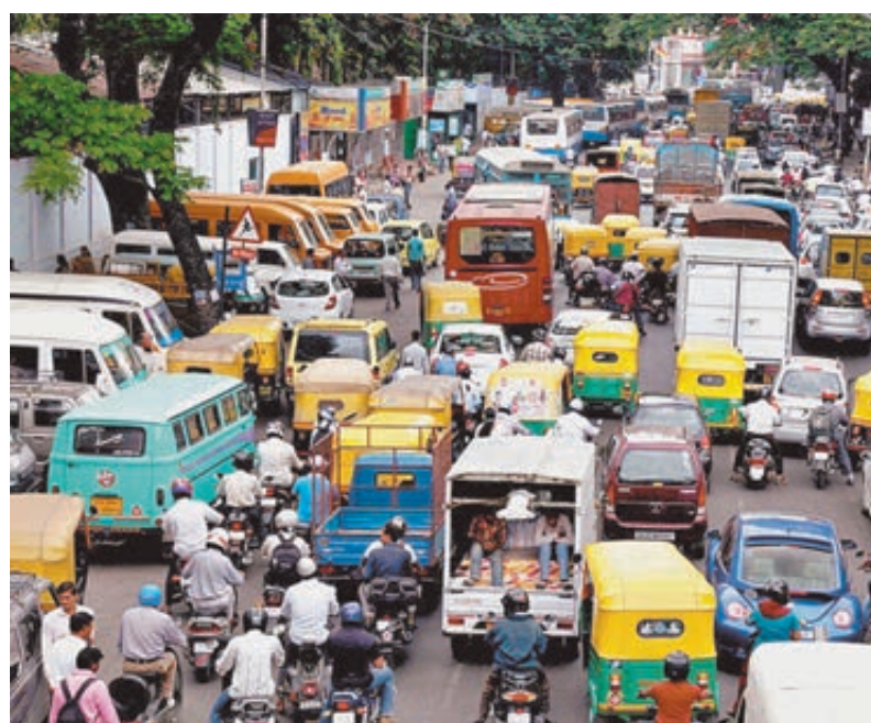
На улицах Дели и Джакарты: жители пересели с велосипедов на автомобили и мотоциклы.

Вхождение в капитал EOL не несет дополнительных кредитных рисков для «Роснефти». Приобретаемая доля не предполагает консолидации, и EOL будет финансироваться на проектом уровне. В качестве источников оплаты сделки «Роснефть» сможет использовать как собственные средства, так и заемное финансирование. Обслуживание внешнего финансирования EOL будет осуществляться за счет денежных потоков, генерируемых активами которых,