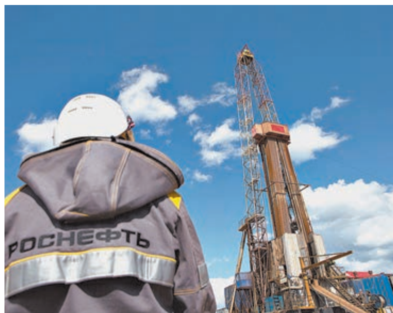
На одном из крупнейших в Восточной Сибири Среднеботуобинском месторождении.

можном приобретении долей в Сузунском, Тагуйском и Лодочном месторождениях, совокупные запасы которых составляют 876 млн тонн нефти, рассматривая их как единый актив.