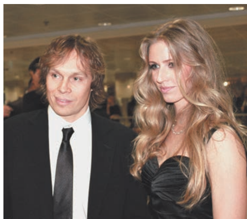
Елена Дементьева с мужем – хоккеистом Максимом Афиногеновым.

– Да, в школе я выучила французский, а английским занялась потом с репетитором. Пришлось возить с собой на турниры учебники и словари, даже в самолетах штудировать. Конечно, помогала и англоязычная теннисная среда – там нужно общаться с коллегами на английском, читать интервью и прочие теннисные публикации. Что касается более серьезной литературы... Французскую читала в оригинале. Увы, без практики язык быстро забывается, сейчас не могу похвастаться, что легко прочитаю любой французский роман с листа. А вообще я читать люблю. Другое дело, что напряженный соревновательный график не располагал к вдумчивому чтению. На турнирах все мысли заняты предстоящей игрой, здесь нужен определенный настрой и вдохновение.