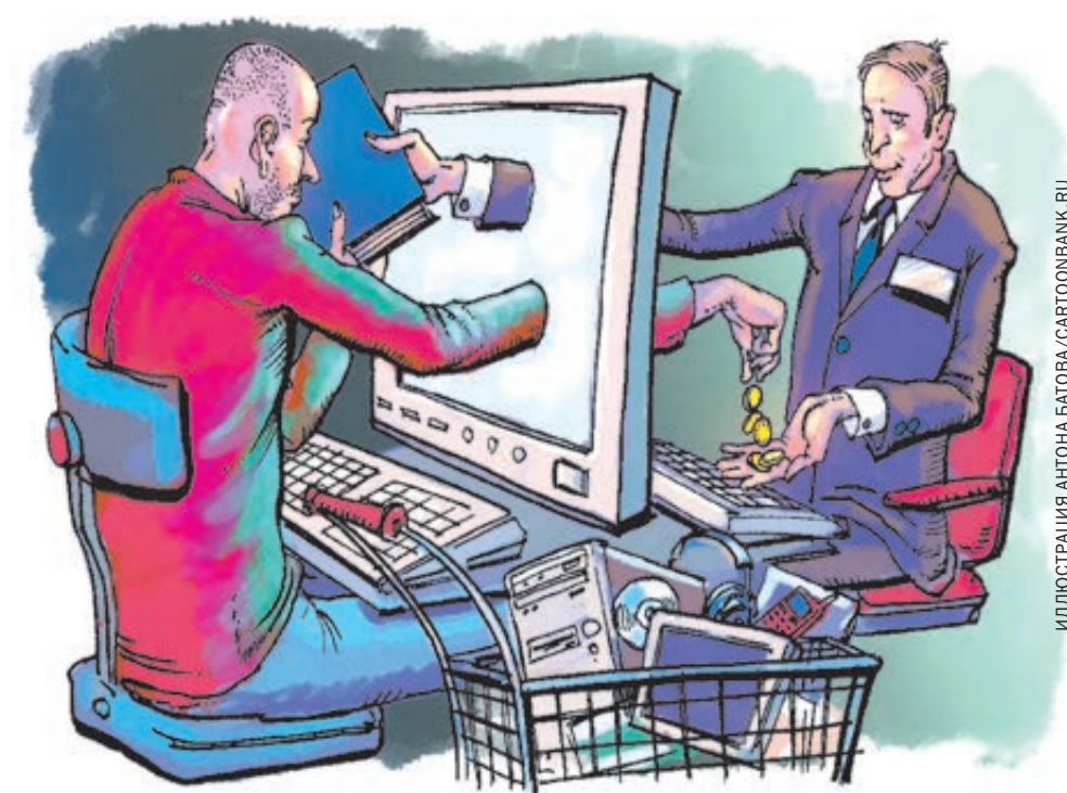
ИЛЛЮСТРАЦИЯ АНТОНА БАТОВА © CARTOONBANK.RU

Немного потребительской математики. Так, смартфон (Huawei Honor 6 Plus) стоит на Алиэкспресс 12 250 рублей – в районе 180 евро. В российских магазинах его цена составляет 17 900 рублей. Есть смысл сэкономить, даже если придется подождать посылку несколько недель. Если бы новые правила действовали уже