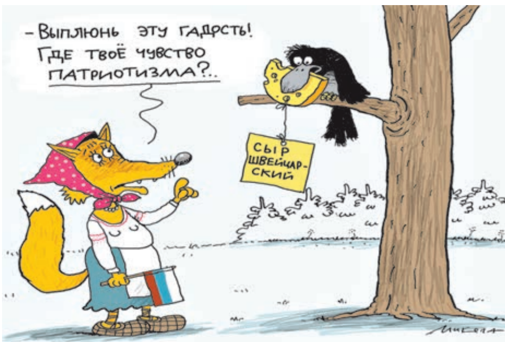
ИЛЛЮСТРАЦИЯ НИКОЛАЯ ВОРОНЦОВА, CARTOONBANK.RU

Напомним: президент Путин ставил задачу обеспечить продовольственную безопасность к 2020 году. В условиях антироссийских санкций и разрыва отношений с Украиной, бывшего всесоюзной житницей, другого выбора просто нет. Но что еще важнее, земли у нас больше, чем нефти, газа и истребителей, причем этот ресурс – неисчерпаемый. При грамотной аграрной политике экспорт продовольствия может стать самой доходной статьёй бюджета и козырной картой в геополитике.