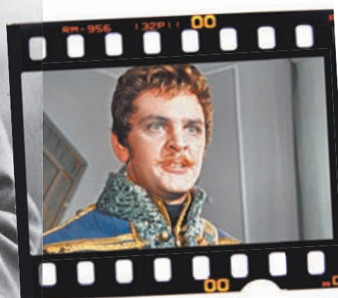
Кадр из фильма «Гусарская баллада».

в год — таким доходом должен был располагать офицер лейб-гвардии в начале XX века. Очень большие деньги по тем временам. А офицерское жалованье покрывало мизерную часть затрат