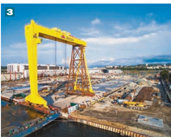
НПЗ Вади́нар (1), Ванкорский кластер (2) и СК «Звезда» (3) – перспективные для инвесторов глобальные проекты «Роснефти» в Евразии.

рами в российскую нефтегазовую отрасль. Все это, однако, не мешает РФ сохранять ведущие позиции на европейском рынке. С 1990 года поставки российской нефти в Европу увеличились в полтора раза – и составили в 2015 году 150 млн тонн. Поставки нефтепродуктов выросли за тот же период более чем на 60% – до 55 млн тонн. Российская нефть обеспечивает около 30% европейского импорта нефтепродуктов – 43%. При этом Россия остается основным поставщиком газа в Европу, обеспечивая свыше 30% спроса на этот энергоноситель.