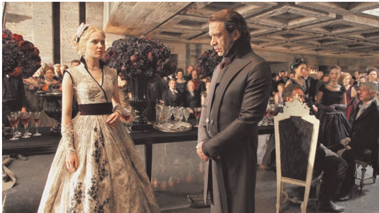
Кадры из фильмов «Дуэлянт» (вверху), «Ледокол».