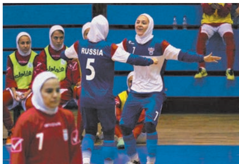
Не удивляйтесь: это футболистки сборной России.

Но исламское лобби стояло на своем, и в 2012 году ему вынуж-