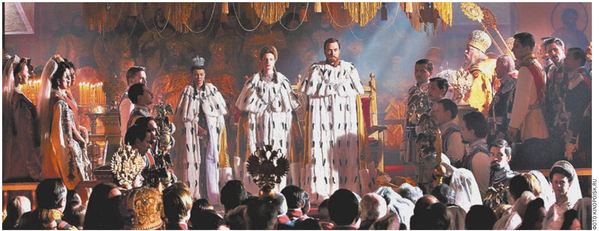
Кадр из фильма Алексея Учителя «Матильда».