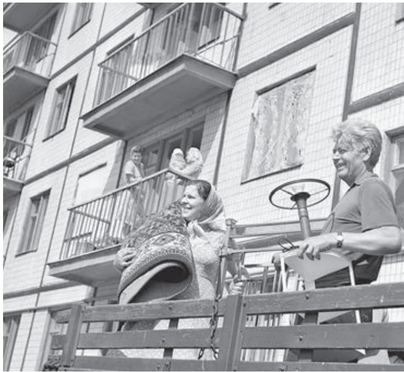
Новоселы, 1963 год.

Существуют и другие трудности. В случае проведения ремонта с заменой перегородок в квартирах необходимо будет расселять жильцов, и кто в итоге будет отделять квартиры – непонятно, так как законодательно эти затраты не про-