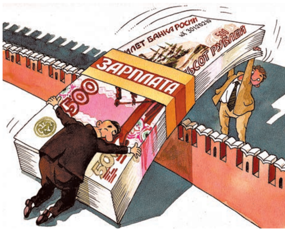
ИЛЛЮСТРАЦИЯ ВЯСЛЕНА ДРУЖИНИНА/САЙТООБРАБОТКА.RU

Сегодня таких ограничений нет, а потому глава государства Владимир Путин получает в год 8,9 млн рублей, а топ-менеджеры «Газпрома» – до 10 млн рублей в месяц и более, Сбербанка – по 16 млн, члены правления РЖД – по 6 млн. Ну, про главу «Почты России» г-на Страшнова вы уже читали и в СМИ, и в заявлениях Генпрокурора.