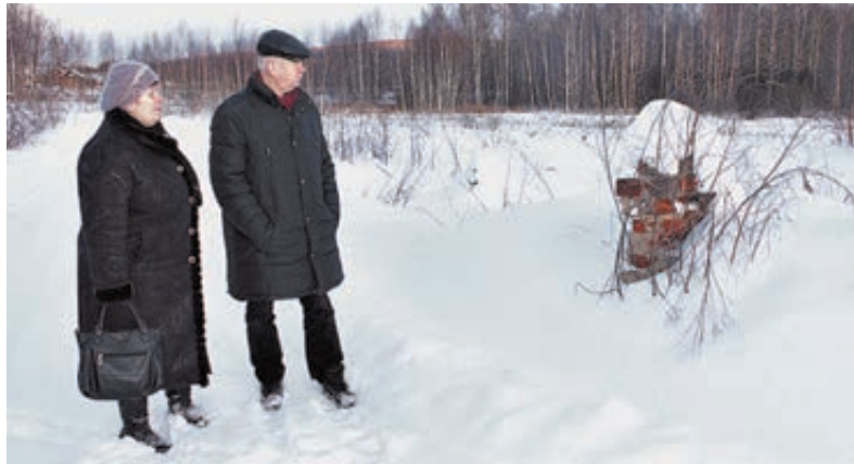
Все что осталось от часовни в Уславцево.