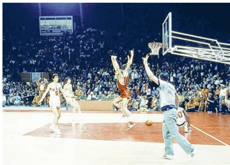
Тот самый матч, те самые секунды...