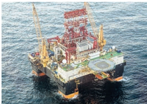
Платформа Scagabeo-9 ищет нефть на дне Черного моря.

По прогнозам первого вице-президента, основной прирост добычи