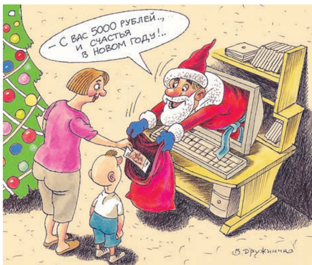
ИЛЛЮСТРАЦИЯ СЕРГЕЯ СЕРГЕЕВИЧА ДРУЖИНИНА

Дедшкольнику, узнав о финансовых успехах внука, был поражен: откуда малолетний «брокер» получил нужные знания и вообще как такая идея пришла в голову? Ответ удивил еще больше. Как сообщил школьник, у них полкласса зарабатывают в интернете, а технология операций с биткоинами «проста как дважды два», к тому