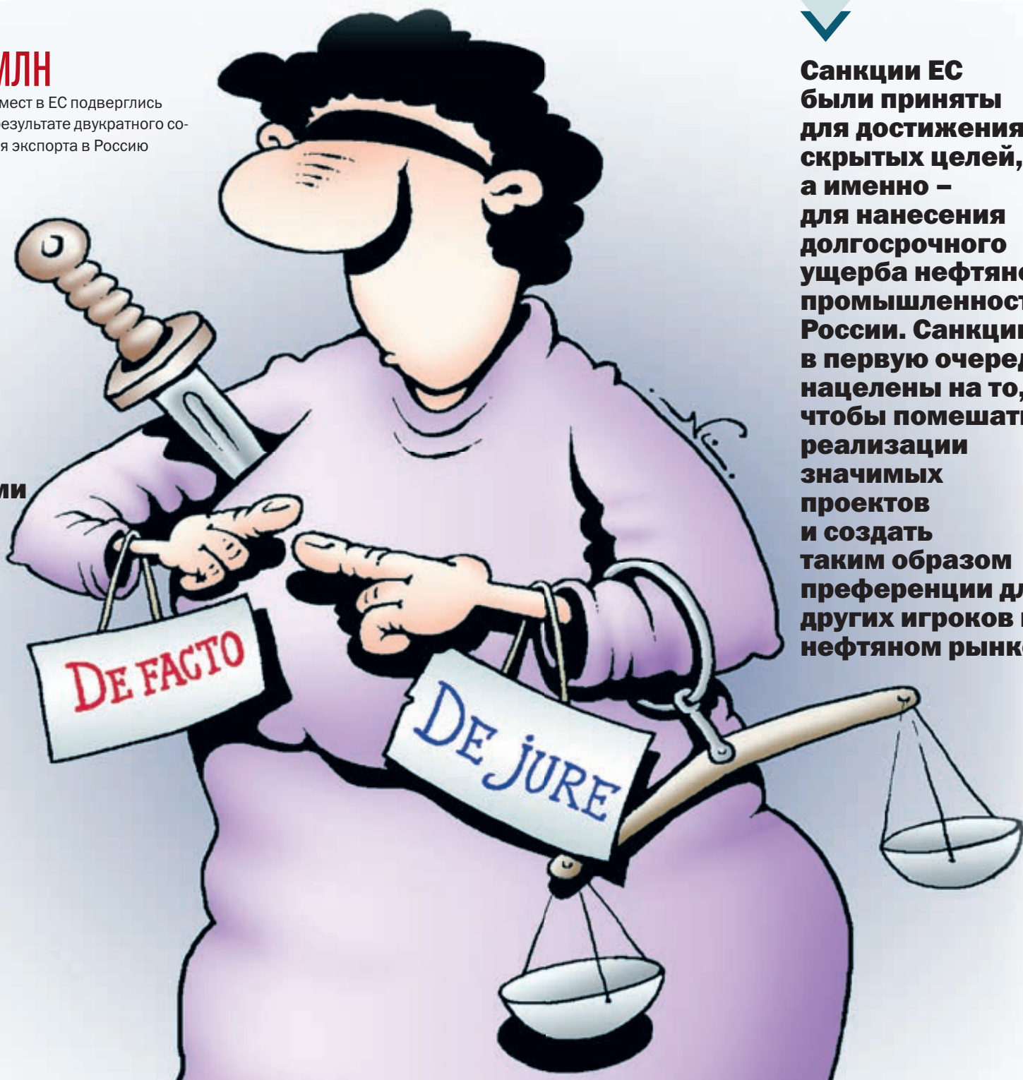
ИЛЛЮСТРАЦИЯ ИГОРА КИЙКО/CARTOONBANK.RU