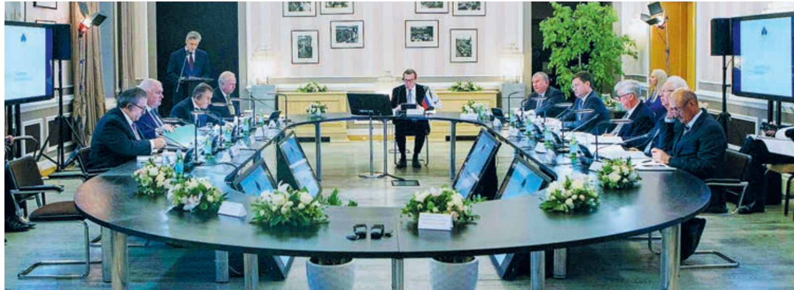
Совет директоров «Роснефти» одобрил стратегию развития компании до 2022 года.

«Роснефть» планирует увеличить добычу жидких углеводородов (нефть и газовый конденсат) на 30 млн тонн в рамках стратегии до 2022 года, заявил в ходе презентации стратегии в Сочи глава «Роснефти» Игорь Сечин.