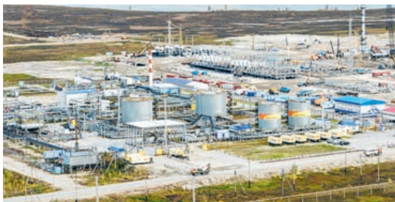
«Роспан» – один из ключевых газовых активов «Роснефти».

придется на 2018–2019 годы, как раз на время запуска крупных проектов, в частности начала добычи на Русском месторождении.