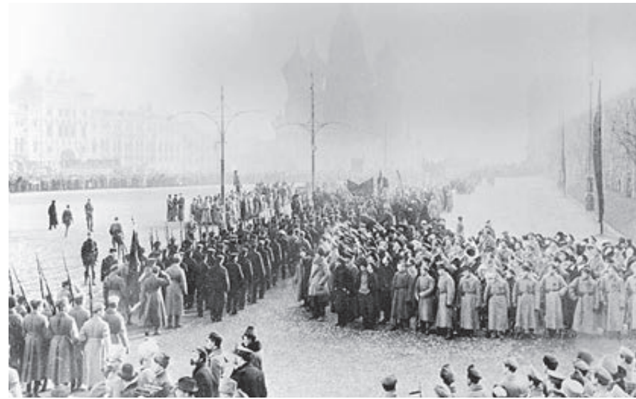
Парад войск Красной армии, посвященный годовщине Октябрьской революции. 7 ноября 1918 года.

Казалось бы, вот-вот Россия исчезнет с карты мира, а новый режим рухнет в небытие. Однако происходит малообъяснимое геополитическое чудо, которое историки потом назовут «триумфальным шествием советской власти». Партия большевиков, одна из самых малочисленных на политической арене уходящей России, невероятным образом в короткое время умудрилась не только захватить и удержать власть в обеих столицах, но и заразить своими лозунгами города и веси. Каждый день 1918-го приходили вести о ревкомах на Дальнем Востоке, в Якутии, Средней Азии, на Кавказе. И о натиске иностранных интервентов, о наступлении Белой гвардии... А на взбаламученных смутой и хаосом просторах металась миллионы людей, не желавших участвовать в исторических событиях, мечтающих лишь выжить – найти хлеб и тихий уголок, где можно отсидеться в страшную эпоху перемен.