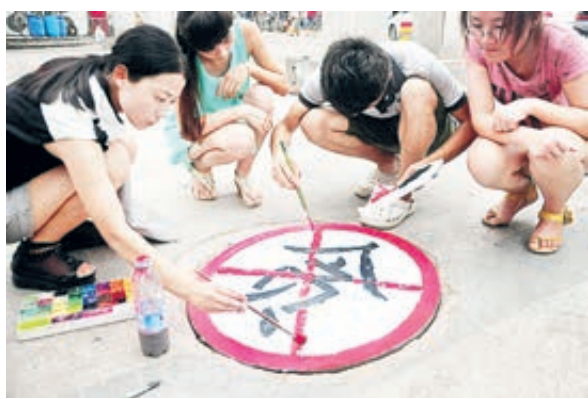
На улице города Ляочэн провинции Шаньдун студенты-волонтеры рисуют антикоррупционные граффити на крышке колодца.

Что касается розыска беглецов и возвращения похищенных денежных средств, вопрос преследования лиц, скрывающихся от следствия, решается положительно, однако проблема возвращения похищенных финансовых средств еще находится в процессе изучения. Можно сказать, что без искоренения проблемы отмывания денег сложно решить вопрос с возвращением украденных денежных средств, поэтому следует совершенствовать систему и механизмы, препятствующие отмыванию денег,