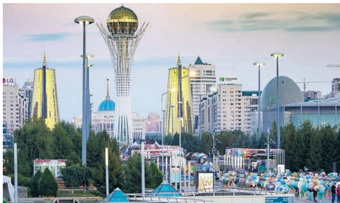
Астана сегодня и в 70-е годы, каких-то 40 лет назад. Почувствуйте разницу!

Власть решила иначе: Астана тоже должна стать оазисом, но гигантского размера. Параллельно со строительством архитектурных шедевров начали создавать лесополосы. И если в Целинограде было бектаров зелени, то нынче вокруг Астаны санитарно-защитная зона уже составляет 86 тысяч гектаров, высажены и принялись 12 млн деревьев и кустарников: сосны, березы, вязы, рябины, тополя. Деревья уже выросли до 10 метров в высоту, во что недавно никто не верил. Появились зверье: лисы, зайцы, косули, фазаны... В самой Астане