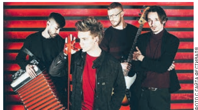
Участники фестиваля «Традиция» группа «Аффинаж».

В подвешенном состоянии оказались масштабные региональные проекты «Рок над Волгой» и KUBANA, ставившие конкуренцию «Нашествию». Первый проводился в Самаре с 2009 года, собирая под палящим солнцем толпы