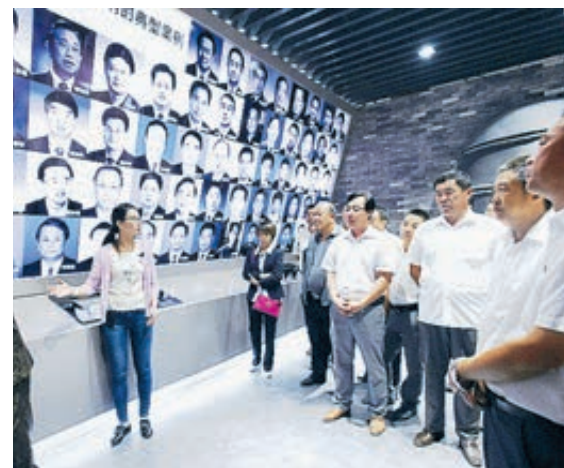
На образовательной базе по борьбе с коррупцией кадровые партийные работники уезда Тахэ города Арал Синьцзян-Уйгурского автономного района проходят обучение.