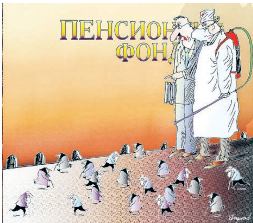
ИЛЛЮСТРАЦИЯ ВИКТОРА БОГОРАДА / САНКТОВАНК

Предложение понравилось министру финансов, первому зампреду правительства Антону Силуанову. Накануне голосования в Госдуме он порадовал страну: «Пенсионная реформа растянется