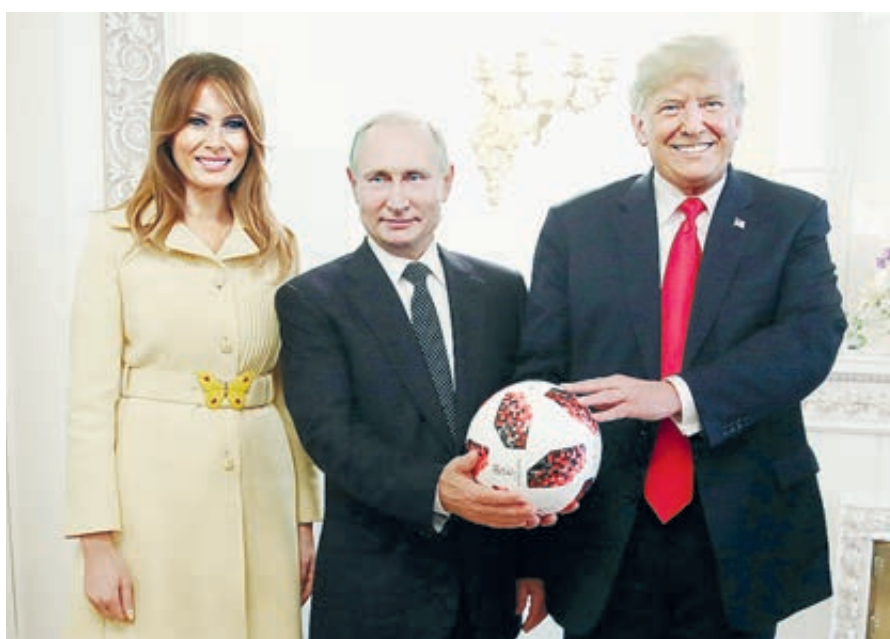
А в Хельсинки участники встречи изучали оптимизм.