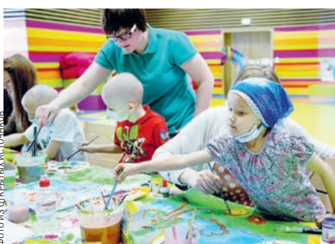
Центр имени Дмитрия Рогачева, пациенты и доктора, спасают детские жизни.