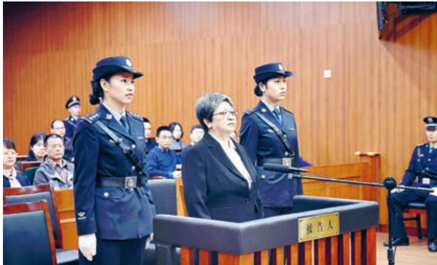
Заместитель мэра города Вэньчжоу Ян Сючжу стала первой задержанной из списка 100 лиц, находящихся в розыске. Приговорена к восьми годам лишения свободы.

Первая половина 2018 года отмечена новыми успехами в строительстве некоррупционного правительства и партийных структур в Китае. Были отстранены от должностей и привлечены к судебной ответственности высокопоставленные чиновники, принят целый ряд антикоррупционных законов, продолжено преследование коррупционеров, сбывавших за границу. Все это свидетельствует об усилении бдительности, неустанных усилиях по противодействию коррупции и поощрению честного и бескорыстного отношения к служебным обязанностям.