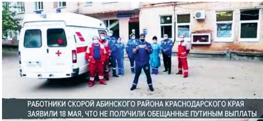
РАБОТНИКИ СКОРОЙ АБИНСКОГО РАЙОНА КРАСНОДАРСКОГО КРАЯ ЗАЯВИЛИ 18 МАЯ, ЧТО НЕ ПОЛУЧИЛИ ОБЕЩАННЫЕ ПУТИНЫМ ВЫПЛАТЫ