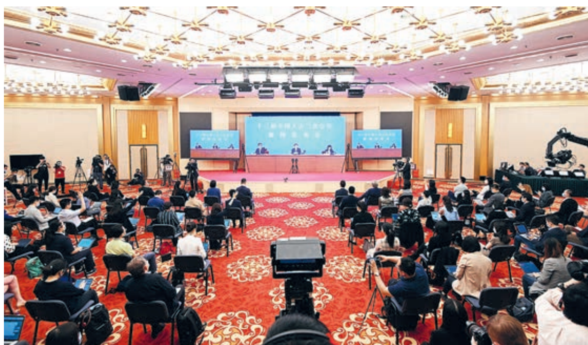
На пресс-конференции, посвященной ежегодной сессии ВСНП.

Сессии предоставят депутатам ВСНП и членам ВК НПКСК прекрасные возможности прийти к согласию, объединить знания и поднять моральный дух для достижения национальных целей. Эпидемия негативно сказалась на китайской экономике. По этой