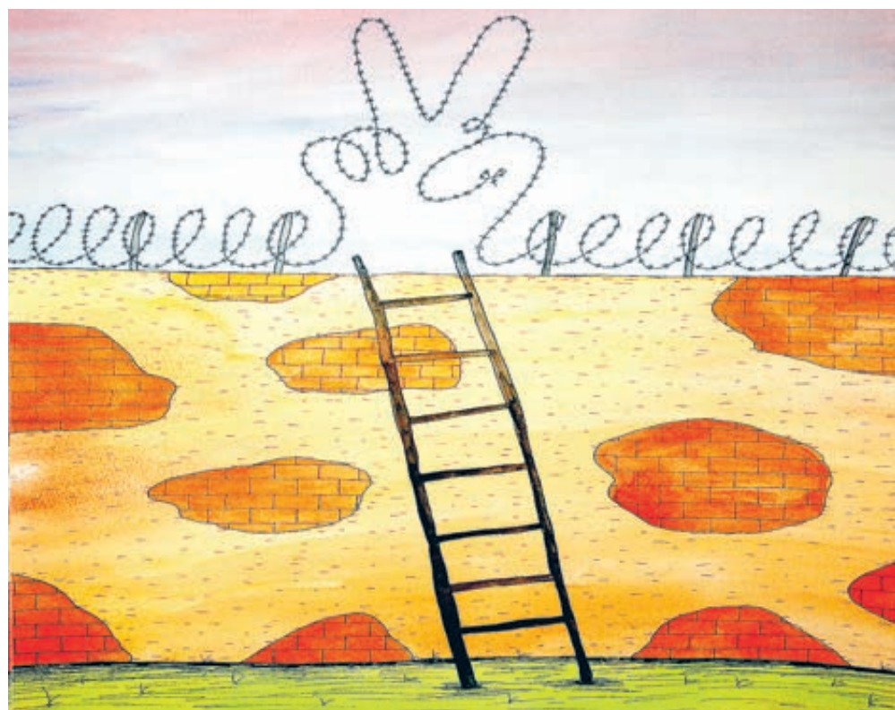
ИЛЛЮСТРАЦИЯ ВЯЧЕСЛАВА ШИЛОВ / CARTOONBANK.RU