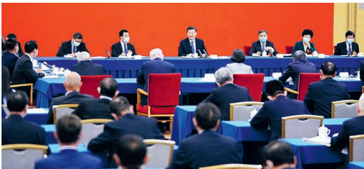
На заседании Всекитайского комитета Народного политического консультативного совета Китая 13-го созыва.

С момента образования Нового Китая впервые Всекитайское собрание народных представителей и Народный политический консультативный совет Китая