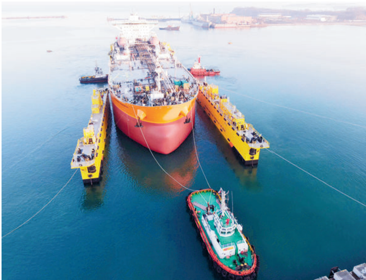
На ССК «Звезда» в мае сошел со стапелей танкер «Владимир Мономах».

Бурение велось с помощью платформы West Alpha, представленной норвежской компанией North Atlantic Drilling West Alpha, платформа была транспортирована через Баренцево, Печорское и Карское моря и установлена на точке бурения на лицензионном участке Восточно-Приноземельский-1. До места назначения буровая платформа преодолела путь свыше 1900 морских миль. Установка способна бурить на глубину до 7 км. На точке бурения она удерживалась с помощью 8-якорной системы позиционирования, что обеспечивало повышенную устойчивость. Большая часть