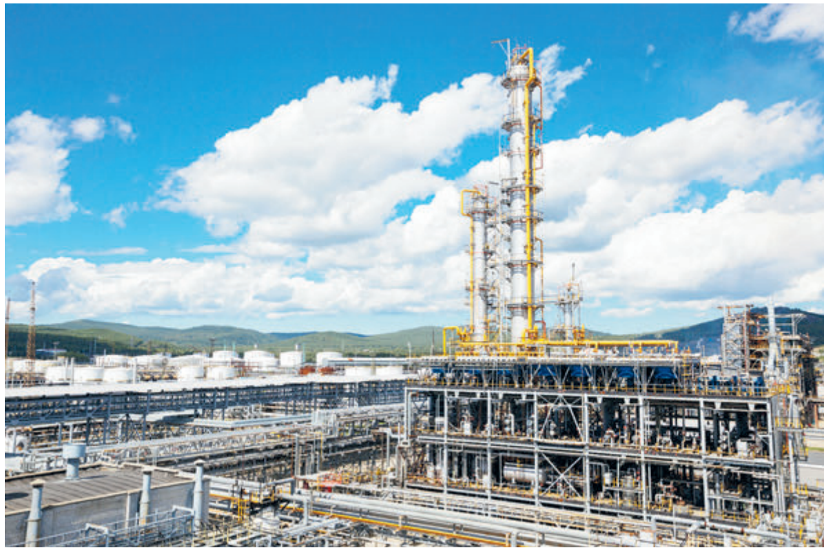
Сегодня все топливо НПЗ «Роснефти» поставляется исключительно на внутренний рынок.

Социальная ответственность – одна из ключевых характеристик компании. На встрече во вторник, 18 августа, Игорь Сечин доложил