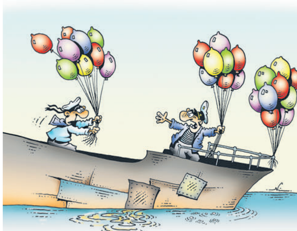
ИЛЛЮСТРАЦИЯ ИГОРЯ КИРКО (SARTEO/SHANK.RU)

С незапамятных времен Магаданскую область называют русским Клондайком. Здесь богатейшие месторождения драгоценных металлов, олова и вольфрама. Имеются залежи меди и молибдена, угля, нефти и газоконденсата. Вторая по значимости отрасль – рыболовство, чья вкуснейшая продукция раньше шла на экспорт, но сейчас сейнеры в основном проваляются минтаем. Да что там рыба! В этом году здесь добудут 46 тонн рудного и рассыпного золота, более 60 тонн серебра. Одних толь-