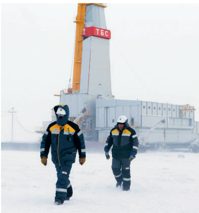
На месторождениях «Восток Ойл» высококачественная нефть добывается в суровых условиях.