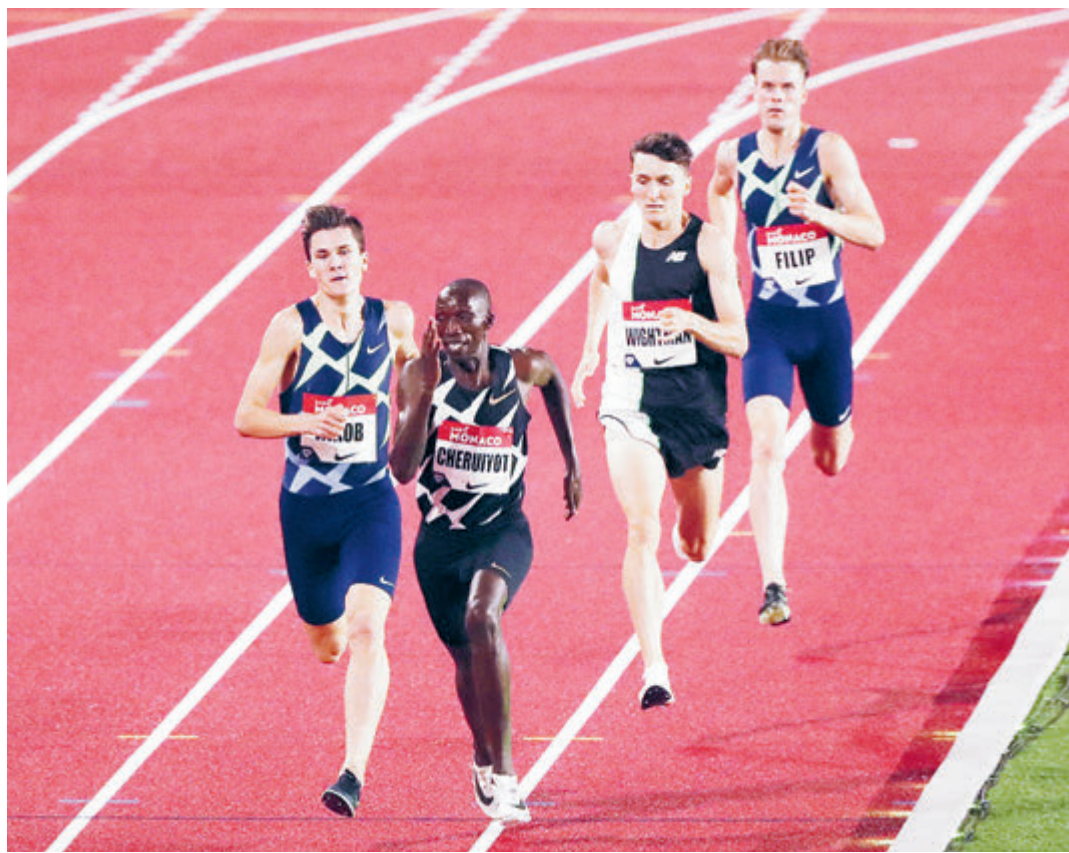
Забег на 1500 метров. Белье бегуны наступают на пятки кенийцу Тимоти Черуйоту. Давно такого не наблюдалось...

Потрясающая борьба шла на дистанции 1500 метров. Чемпион мира Тимоти Черуйот из Кении тоже устроил гонку за новым мировым рекордом. Его вели по дистанции два «зайца». Но когда они сошли, лидера начала стремительно настигать тройка соперников. Лишь в финишных клетках опытный Черуйот опередил 19-летнего норвежца Якоба Ингебригтсена, показав лучший результат сезона в мире: 3.28.45. А вот дальше расположились Якоб Ингебригтсен, установивший рекорд Европы (3.28.68), британец Джейк Уайтман (3.29.47) и старший