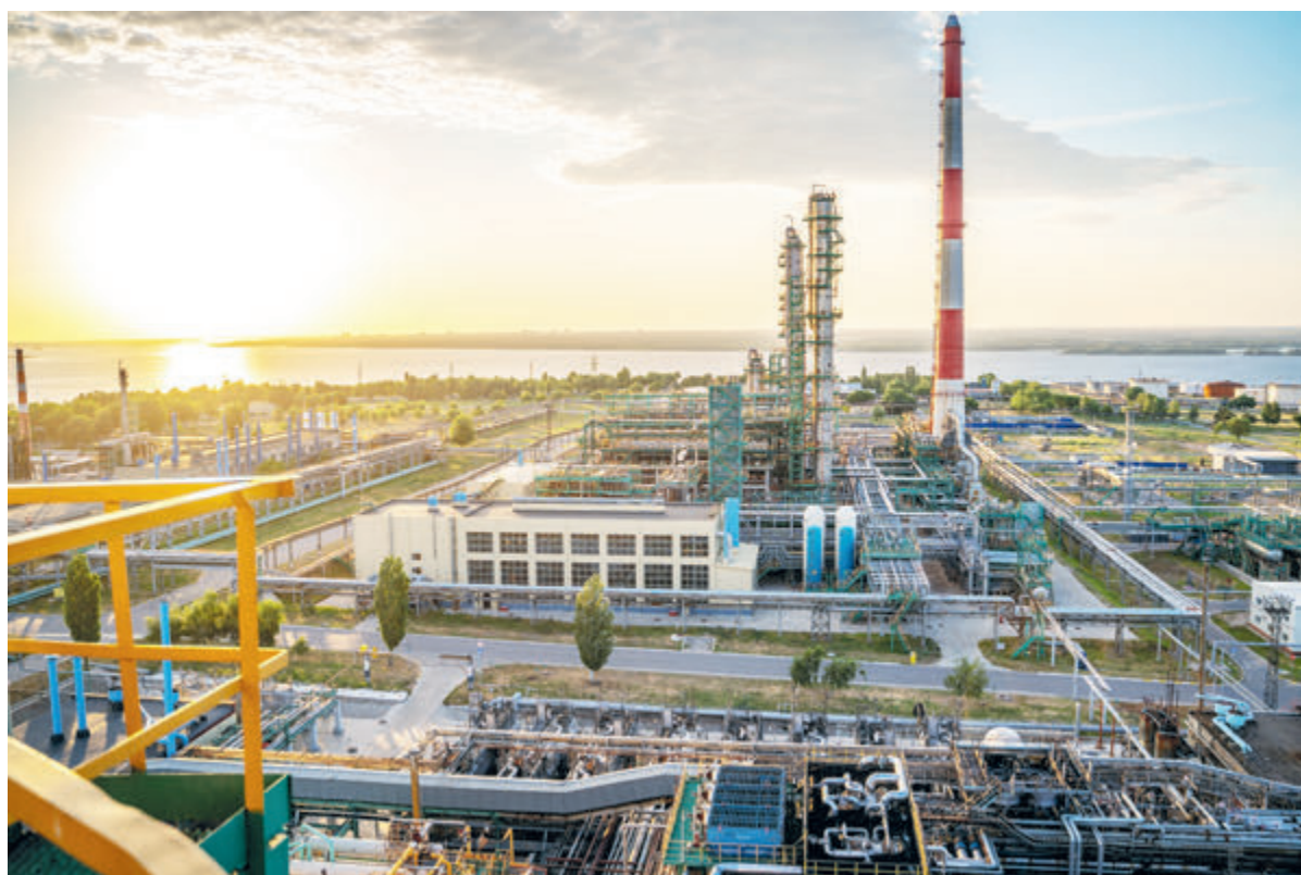
«Роснефть» сохраняет лидерство в российской нефтепереработке.

На Пронькинском месторождении «Оренбургнефти» введена в эксплуатацию уникальная горизонтальная скважина, пробуренная по технологии Fishbone. Стартовый дебит скважины в карбонатных пластах составил 66 тонн нефти в сутки при фактических параметрах работы традиционных наклонно направленных скважин в 5–25 тонн нефти в сутки. Новая скважина имеет вертикальную глубину 1860 метров, длину основного горизонтального ствола – 1000 метров и общую суммарную длину четырех ответвлений – 1200 метров. Такое технологическое решение позволило повысить эффективность отдачи пласта, а также оптимизировать процесс бурения.