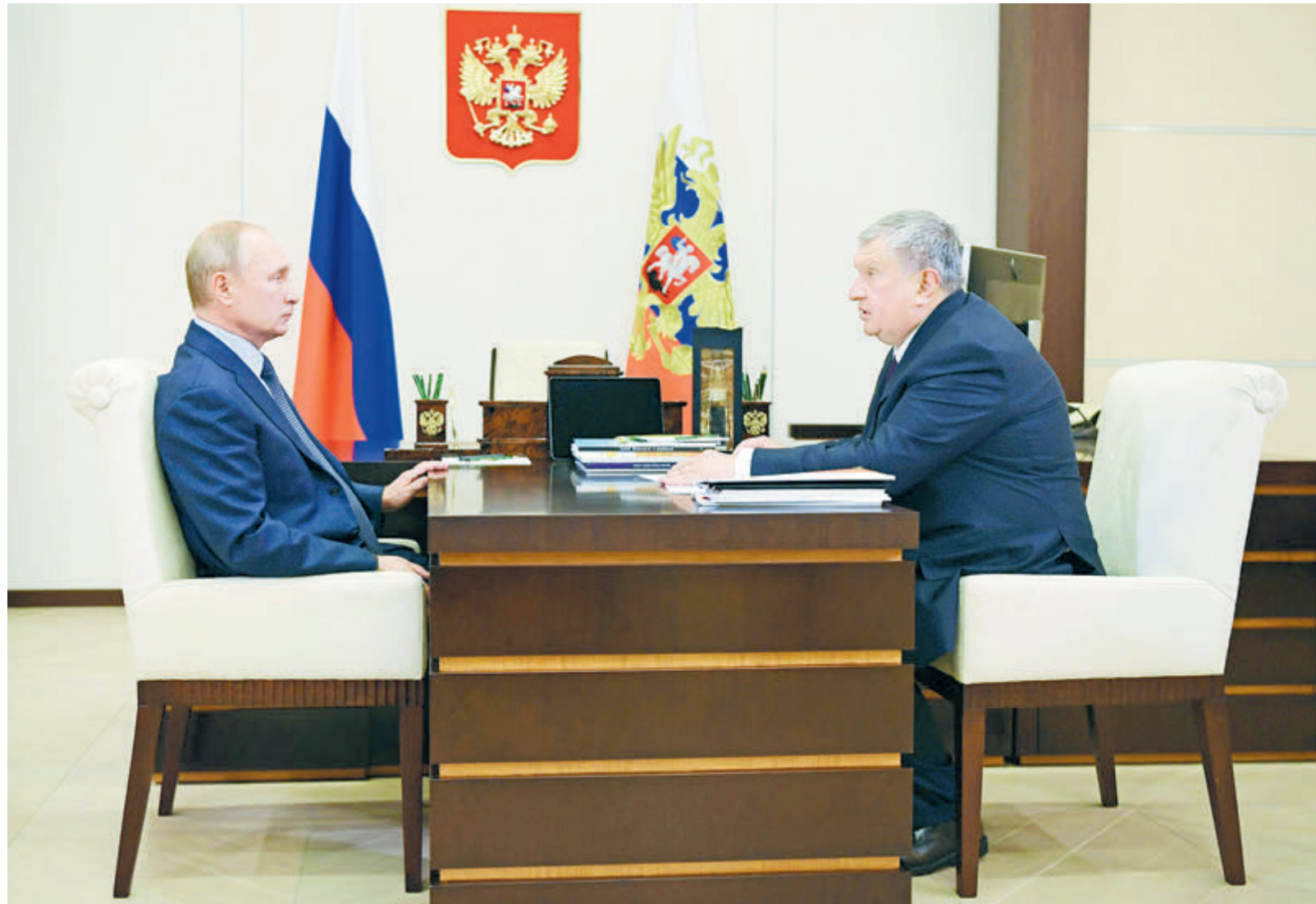
Президент России Владимир Путин провел встречу с главой «Роснефти» Игорем Сечиным.

«Восток Ойл» – один из крупнейших и наиболее перспективных проектов в мировой нефтегазовой отрасли. Ресурсный потенциал проекта составляет