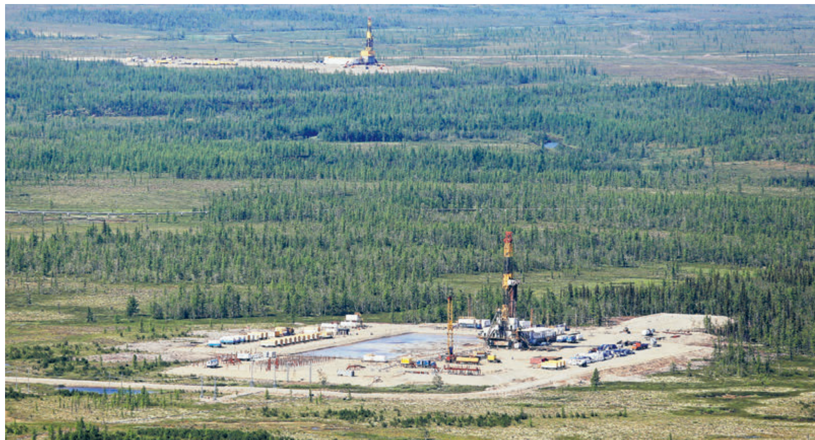
Проект «Восток Ойл» объединил уже разработанные месторождения Ванкора и новые месторождения на севере Красноярского края.

Ожидается, что во втором полугодии показатели вырастут. «По мере восстановления цен на нефть и нефтепродукты показатели финан-