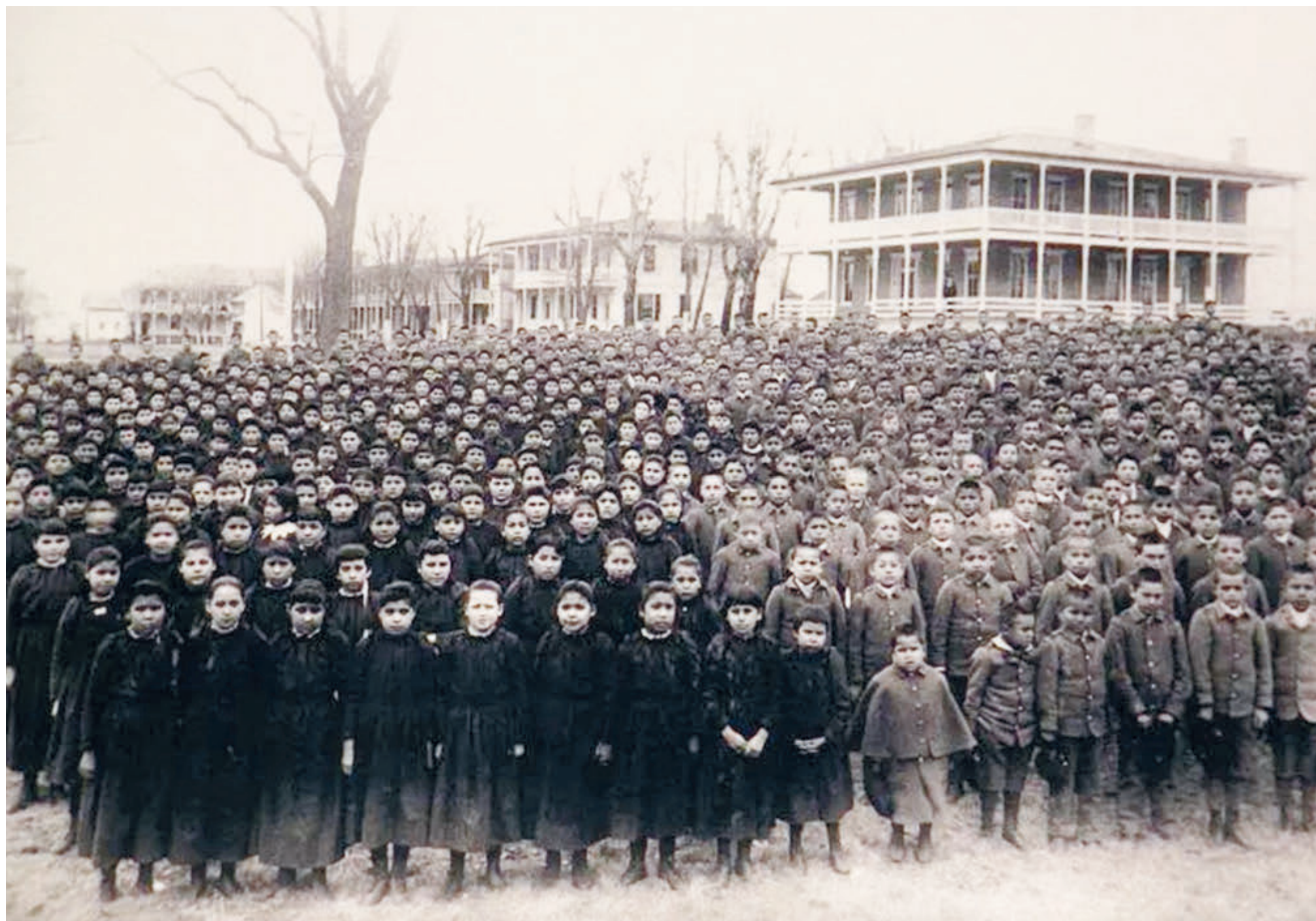
Учащиеся Индийской промышленной школы Карлайла собираются на школьной площадке в марте 1892 года.

Во-вторых, это сопровождалось кровавыми расправами и зверствами. С момента провозглашения независимости в 1776 году правительство США совершило более 1500 рейдов, нападая на индейские племена, истребляя индейцев, захватывая их земли и имущество, совершая многочисленные преступления. Например, в 1814 году Соединенные