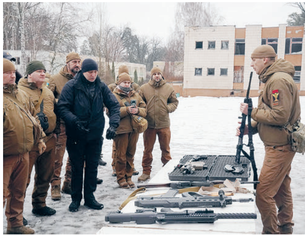
Раздача гражданам оружия на Украине стала делом обыденным.

Украина уже получила или ожидает большое количество противотанкового вооружения. Так, Греция и Словакия поставляют старые гранатометы РПГ-7 и боеприпасы для них. Швеция готовит к отправке 5 тысяч своих гранатометов АТ4. Из Канады доставят не менее 125 изделий Carl Gustaf. Самые массовые поставки