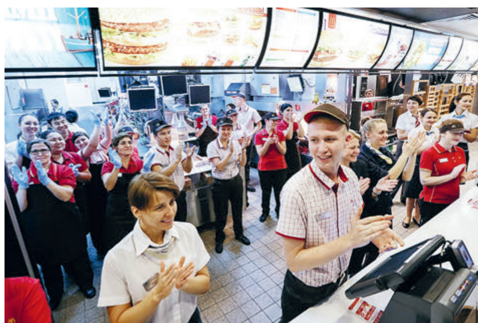
Все этим сотрудникам российского «Макдоналдса» придется искать новую работу.

Для этого важно подать заявление не позднее чем через 15 дней после второго безработного месяца. Еще если успеть встать на учет в службу занятости в первые две недели после увольнения, можно будет стребовать с бывшего работодателя пособие и за третий месяц. Для его оформления кроме письменного заяв-