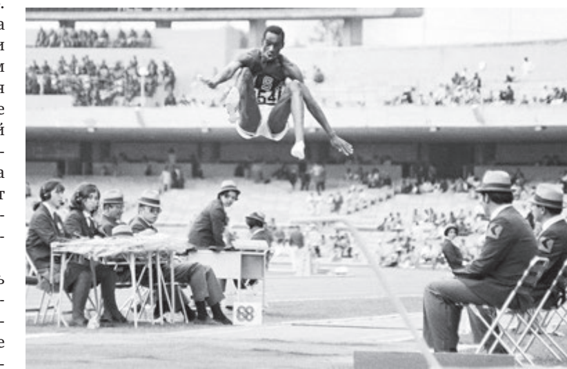
Автор «рекорда века» Боб Бимон после своего феноменального прыжка на 8,90 недолго оставался в большом спорте. Ушел совсем молодым.

И еще спасибо современной медицине. Новейшие препараты ускоряют восстановление от ударных нагрузок. Вечный бич бывших чемпионов – надорванные мышцы и связки – лечатся эффективнее, а благодаря современным методам и инвентарю их удается избегать. ■