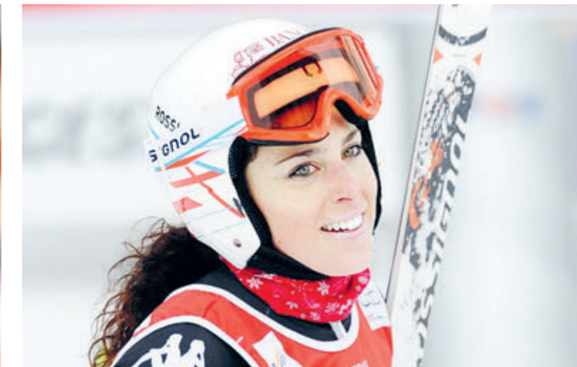
Федерика Бриньоне и Лара Гут назвали себя «старыми курицами». Явно погорячились.