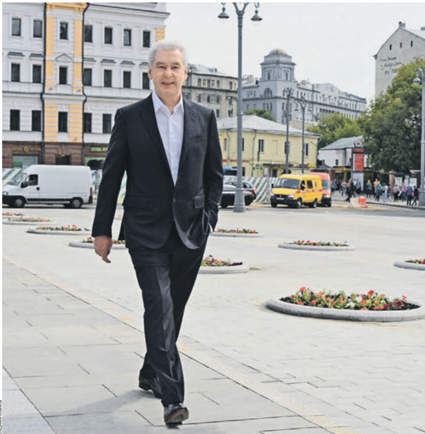
28 июля 11:07 Мэр Москвы Сергей Собянин идет по Славянской площади. Еще несколько лет назад она была заставлена автомобилями, теперь здесь создаются комфортная и благоустроенная пешеходная зона и крупный транспортный узел

— Славянская площадь преобразается. Основные работы закончены, — сказал мэр Москвы Сергей Собянин, добавив, что «Славянска» будет одним из крупнейших транспортных хабов в центре сто-