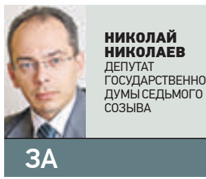
НИКОЛАЙ НИКОЛАЕВ ДЕПУТАТ ГОСУДАРСТВЕННОЙ ДУМЫ СЕДЬМОГО СОЗЫВА

Так что наш законопроект решает целый ряд практических моментов. И его главное призвание — существенно упростить жизнь дачникам и садоводам.