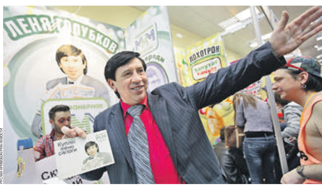
13 марта 2010 года. Актер Владимир Пермяков, более известный россиянам как Леня Голубков, на Дискоотеке 90-х. «Леня!» — кричат ему люди. Актер привычно улыбается

В этот день 26 лет тому назад печально известная финансовая пирамида «МММ» начала свою первую рекламную кампанию. Старт был шумным — 31 июля 1991 года все москвичи могли бесплатно прокатиться на метро. «Фирма платит!» Пожалуй, не имеет смысла подробно описывать все аспекты этой одиозной организации, обложившей многие миллионы граждан новообразованной России. Что и говорить — финансовая пирамида! Да, ни одна цивилизованная страна не допустила бы такого обмана своих граждан. Но, увы, тогда мы были еще столь неопытны! По оценкам следствия, от этого жульничества пострадали более 10 тысяч человек, а независимые эксперты говорят, что свои деньги потеряли около 10 миллионов россиян! Поражает агрессивная рекламная кампания «МММ», благодаря которой эта организация начала греметь на всю страну. Чтобы узнать, как возможно столь эффективное промывание мозгов, корреспондент «ВМ» поговорил с актером Владимиром Пер-