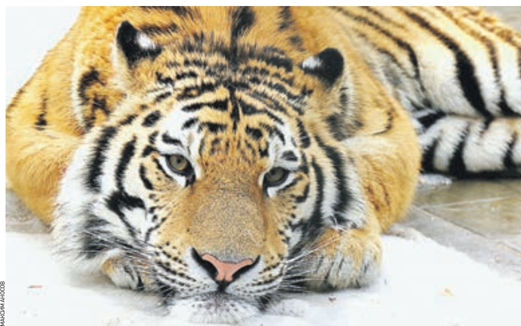
Вчера 10:15 Тигр Степан проводит последние минуты в Центре передержки перед переездом