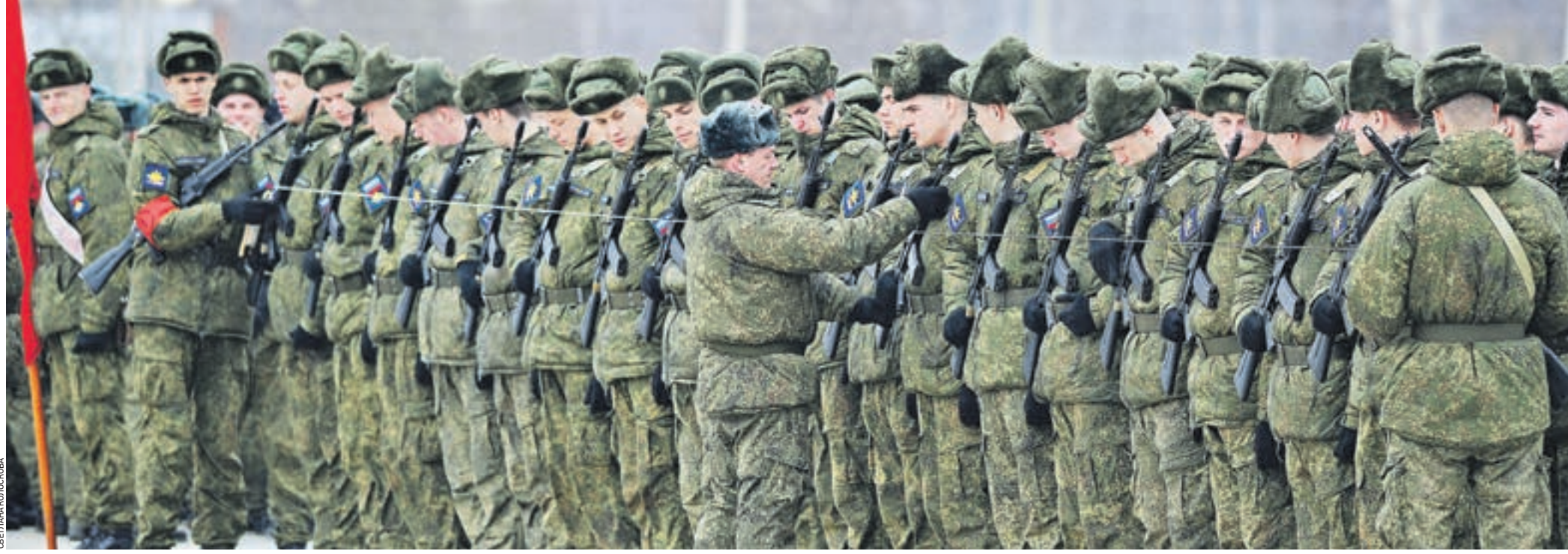
Вчера 11:30 Алабино. Репетиция Парада Победы. Командование одного из 27 парадных расчетов пешей колонны буквально по линейке вымеряет внешний вид своих подчиненных перед очередным прогоном. Через месяц этим ребятам предстоит пройти строем по брусчатке Красной площади, где за ними будут наблюдать миллионы глаз: важен и внешний вид, и четкость действий