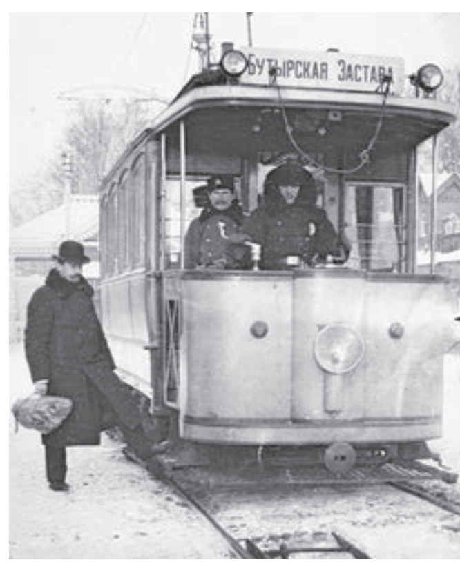
1900 год. Первый регулярный маршрут трамвая, следующий от площади Бутырская Застава до Петровского парка