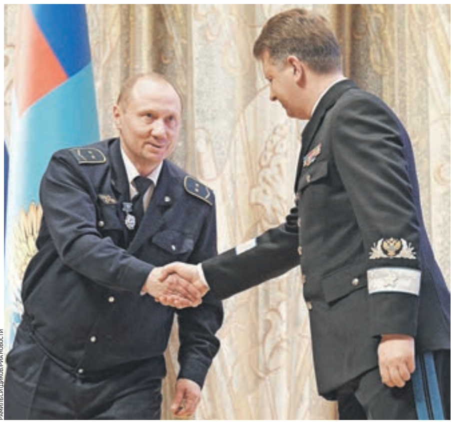
Вчера 18:16 Министр транспорта Российской Федерации Максим Соколов (справа) награждает машиниста электропоезда Александра Каверина

Некоторые депутаты Госдумы после теракта в Санкт-Петербурге предлагают ужесточить антитеррористическое законодательство. Пока прозвучало два более-менее конкретных предложения: вернуть смертную казнь и пересмотреть миграционный режим. Что еще может быть предложено? И нужно ли вообще ужесточать действующее российское законодательство в области борьбы с терроризмом? Мнения колумнистов «ВМ» разошлись.