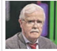
ЛЕОНИД КИТАЕВ-СМЫК ПСИХОЛОГ

Предложено создать ведомство по борьбе с одиночеством. И как вам?