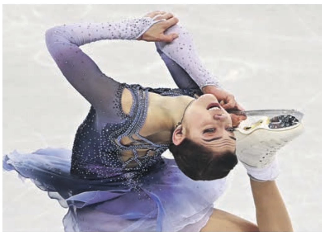
11 февраля 2018 года. Евгения Медведева выступает в короткой программе женского одиночного катания командных соревнований по фигурному катанию на XXIII зимних Олимпийских играх в Пхенчхане

моей любимой супруги ничего бы не получилось. Они поддержали мое решение. На самом деле я не пытаюсь кому-то что-то доказать или показать. Просто спорт — это моя жизнь. Моя работа. То, что я выбрал в детстве. Путь к моей мечте. Но эту победу в голову не беру. Впереди две дистанции, очень хочется побороться за пьедестал почета, потому что я могу это сделать!» Впервые командные соревнования по фигурному катанию попали в олимпийскую программу на Олимпиаде в Сочи в 2014 году. На родном льду российская команда четыре года назад открыла счет золотым медалям. В Южной Корее россиянам вновь удалось подняться на пьедестал почета. Евгения Медведева, Алина Загитова, Михаил Коляда, а также Екатерина Боброва и Дмитрий Соловьев, Евгения Тарасова и Владимир Морозов, Наталья Забияко и Александр Энберт завоевали серебряные медали. Московская фигуристка Евгения Медведева в рамках выступления на командных соревнованиях побилла свой же мировой рекорд в короткой программе, который установила в прошлом году. Для двукратной чемпионки мира Евгении Медведевой эти Олимпийские игры стали дебютными: «Самым интересным был въезд в Олимпийскую деревню, — говорит Медведева. — Все так не-