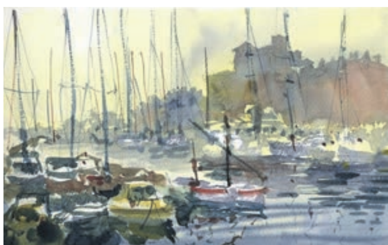
Акварельная работа главного архитектора Москвы Сергея Кузнецова. На ней изображено строящееся сейчас здание филармонии в парке «Зарядье». (1) Вид с набережной Круазет в Каннах (2)