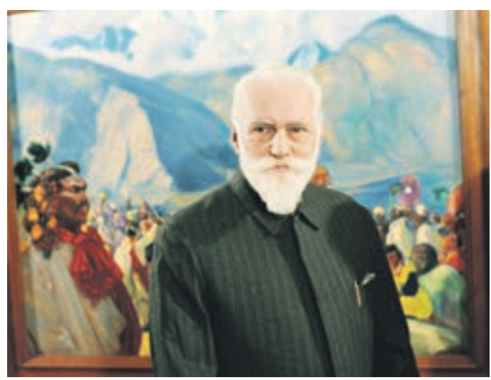
1991 год. Москва. Художник Святослав Рерих передал России наследие своей семьи

Верховный суд РФ опубликовал определение, смысл которого в том, что высшая юридическая инстанция не намерена пересматривать решения трех нижестоящих судов в отношении «дела Рерихов». По иску Государственного музея искусства народов Востока суды обязали Центр Рерихов (МЦР) освободить одно из зданий в центре Москвы, в Малом Знаменском переулке. «Приведенные организационные доводы не могут быть признаны основанием для отмены обжалуемых судебных актов