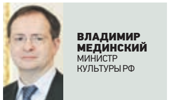
ВЛАДИМИР МЕДИНСКИЙ МИНИСТР КУЛЬТУРЫ РФ

В конце выступления хочу рассказать и о других отраслях культуры, которые также развиваются. За последние годы посещаемость театров выросла почти на треть, посещаемость музеев увеличилась более чем на 50 процентов, а их доходы выросли на 150 процентов. Также для нас был удивительным филармонический бум — покупка абонемента увеличилась на 27 процентов.