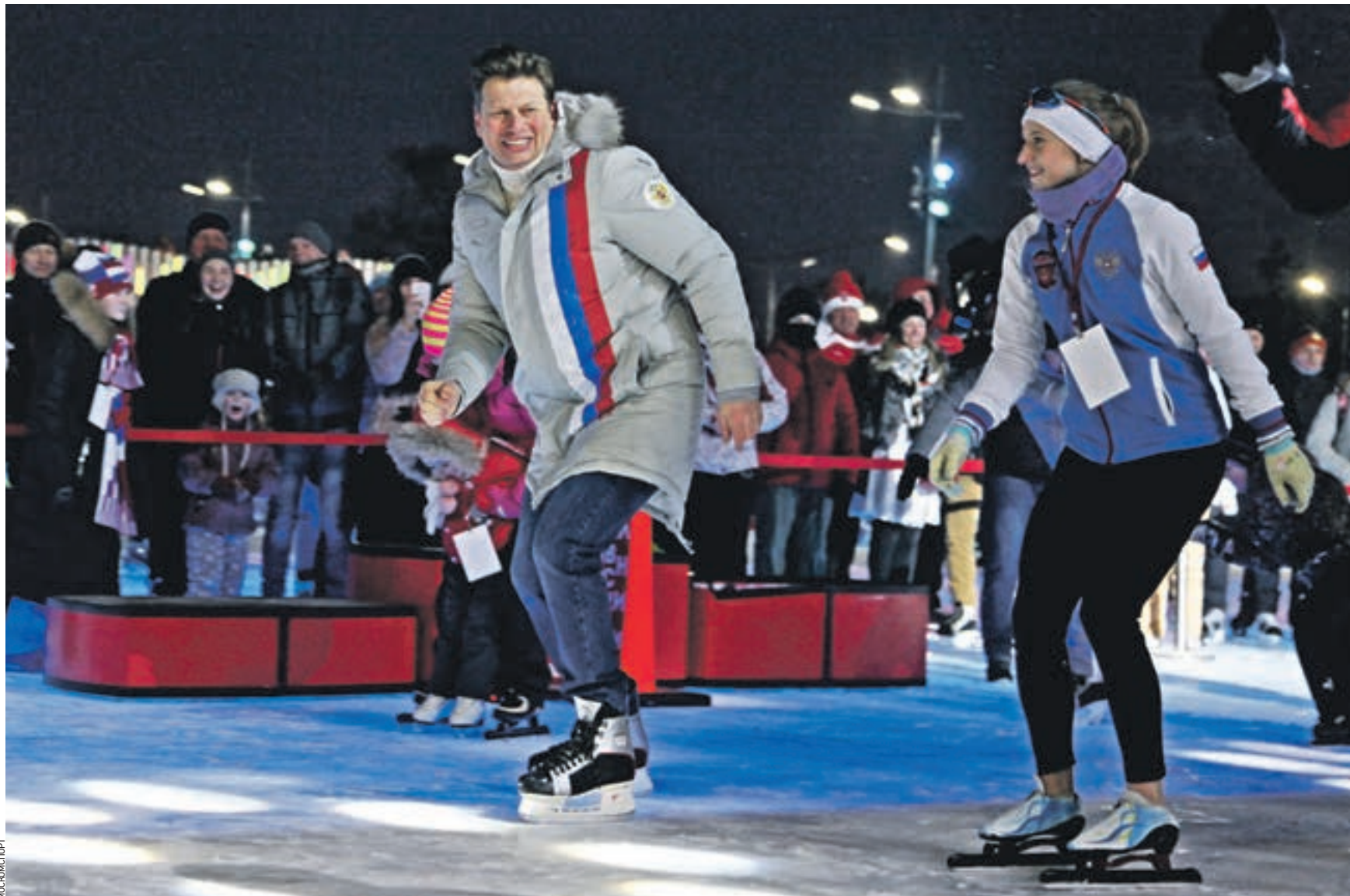
10 февраля 2018 года. Каток ВДНХ, где прошел конькобежный фестиваль «Московские молнии». На фото (в центре) руководитель Департамента спорта и туризма города Москвы Николай Гуляев

Этот праздник быстро обзавелся собственными традициями. И вполне естественно, что отмечается он непосредственно на спортивных аренах и стадионах города. Главными событиями Дня зимних видов спорта регулярно становятся соревнования, подобные «Московским молниям». Вместе с любителями активного зимнего отдыха на лед в этот день вышли звезды конькобежного спорта. Мастерство на льду новичкам продемонстрировали: руководитель Департамента спорта и туризма города Москвы, олимпийский чемпион по конькобежному спорту 1988 года в беге на 1000 метров Николай Гуляев