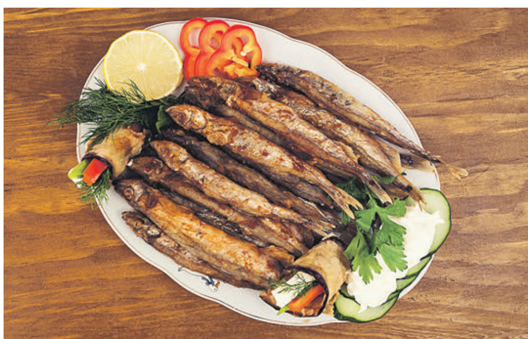
Копченая мойва — очень вкусное и недорогое блюдо. Но найти по-настоящему вкусный и безопасный продукт в супермаркетах не так просто

В образце «Рыбная история» («Ашан/Морепродукты») эксперты выявили консерванты — не указанную в составе сорбиновую кислоту и указанный в составе бензоат натрия. — Налицо — явное нарушение технологии, потому что использование этих консервантов не предусмотрено техническим регламентом для рыбы холодного копчения, — рассказала Елена Меньчихина. — При этом, что интересно, обнаруженное количество бензойной и сорбиновой кислот превышает максимальное допустимое для аналогичной продук-