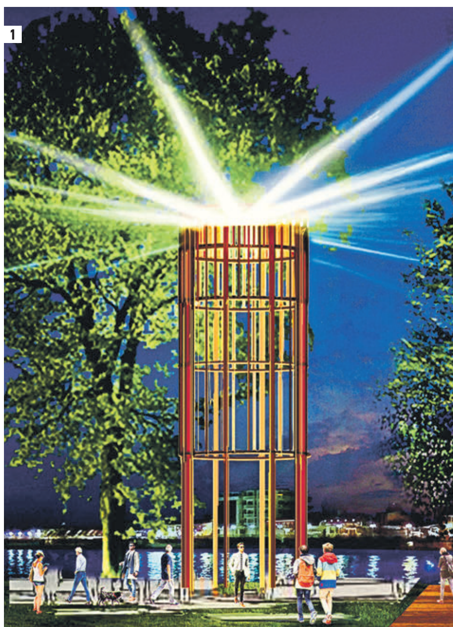
1 Проект архитектурно-художественной подсветки на набережной в Капотне. К монтажу конструкций уже приступили (1) 8 июня 12:30 Заммэра Москвы по вопросам ЖКХ Петр Бирюков рассматривает полимерцементный материал, которым укрепляют фасады жилых домов. Этот материал разработали российские специалисты, и его впервые применяют при ремонте фасадов в Капотне (2)

Капотня стала первым районом Москвы, в котором городские власти начали комплексное обустройство. Правительством Москвы разработана концепция преобразования всего района. Это значит, что одновременно обновятся практически все — и жилые дома, и дворы, и зеленые зоны, и набережные, и пешеходные маршруты. Также расширят проезжие части, проложат четыре километра водосточных систем — внутреннего ливневода. Инспекцию работ, идущих в районе, провел заместитель мэра Москвы по вопросам ЖКХ и благоустройства Петр Бирюков. По его словам, всего через пять лет всю столицу можно будет объехать по паркам. Об этом Петр Павлович говорил, стоя на левом берегу Москвы-реки, на набережной в Капотне, протяженность которой — десять километров. Еще весной эта заброшенная территория была местом отстоя речных судов. Однако «серая» зона уже преобразуется: на 90 гектарах парка, расположенного вдоль набережной, появятся 15 спортивных площадок, медпункты, пункты обеспечения безопасности, сообщили в Комплексе ЖКХ столицы. Также можно будет подойти к берегу реки, чтобы в жаркие деньки отдохнуть у воды. А зимой тут можно будет покататься на санках, сноубордах, горных лыжах. Продумана каждая де-