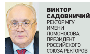
Виктор Садовничий Ректор МГУ Имени Ломоносова, Президент Российского Союза Ректоров первый микрофон

Огромные преобразования претерпевает и система целевого набора студентов. Существенное влияние в этой области оказало постановление правительства, согласно которому каждый университет обязан выделять 10-20 процентов бюджетных мест на студентов, приходящих с направлением от определенной организации. И если в целом конкурс представляет из себя около семи человек на место, то здесь отбор будет внутренним и чуть более лояльным.