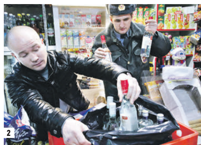
16 июля. Торговля одеждой на одном из несанкционированных рынков города (1) 15 декабря 2018 года. Полицейские изымают в магазине «левую» водку (2)