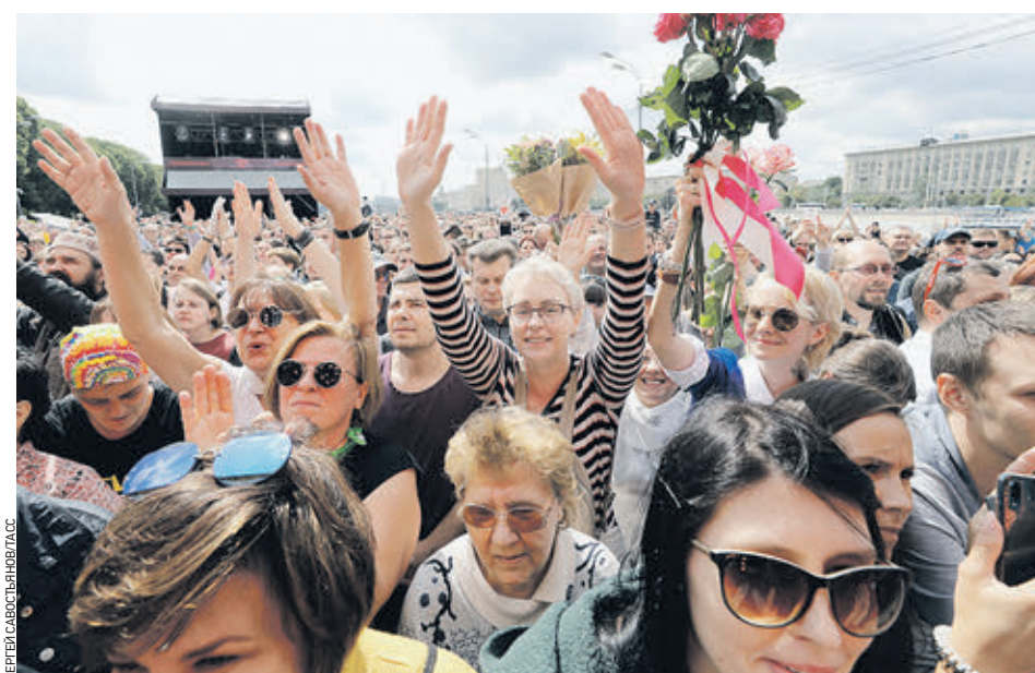
3 августа 11:00 Почти 305 тысяч человек посетили в эти выходные фестиваль «Шашлык Live», который состоялся в Парке Горького. Такие данные приводит официальный портал мэра Москвы mos.ru. Гости праздника не только попробовали невероятное количество шашлыка, но и подпевали группам «Чайф», «Сплин», «75», Uma2rman, которые выступили на фестивале