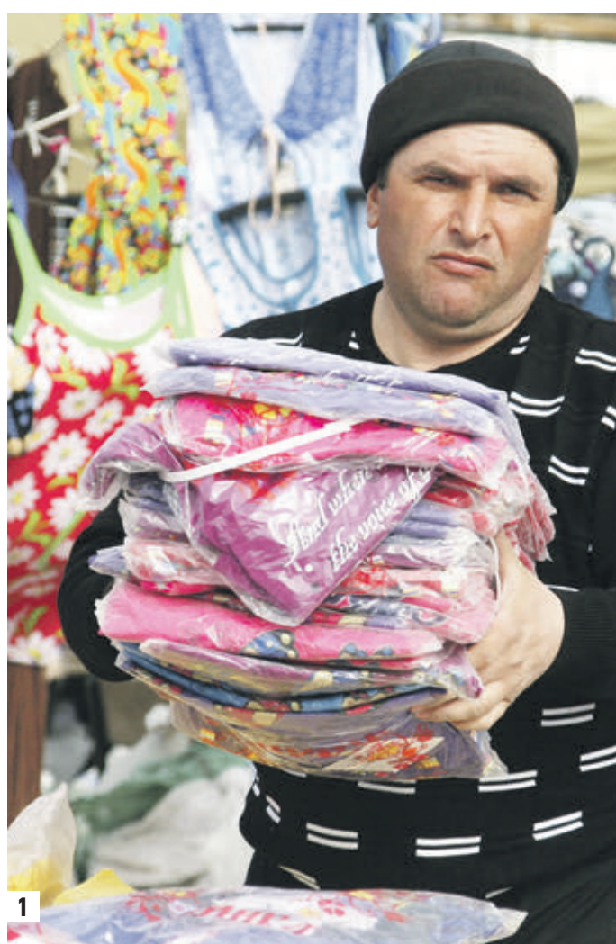
16 июля. Торговля одеждой на одном из несанкционированных рынков города (1) 15 декабря 2018 года. Полицейские изымают в магазине «левую» водку (2)