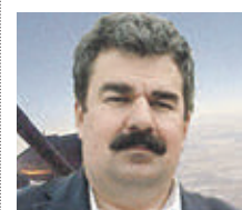
АЛЕКСЕЙ ЛЕОНОВ Военный эксперт

большой арсенал этого вооружения в мире. Политическое обвинение России — лишь формальный повод для выхода из ДРСМД.