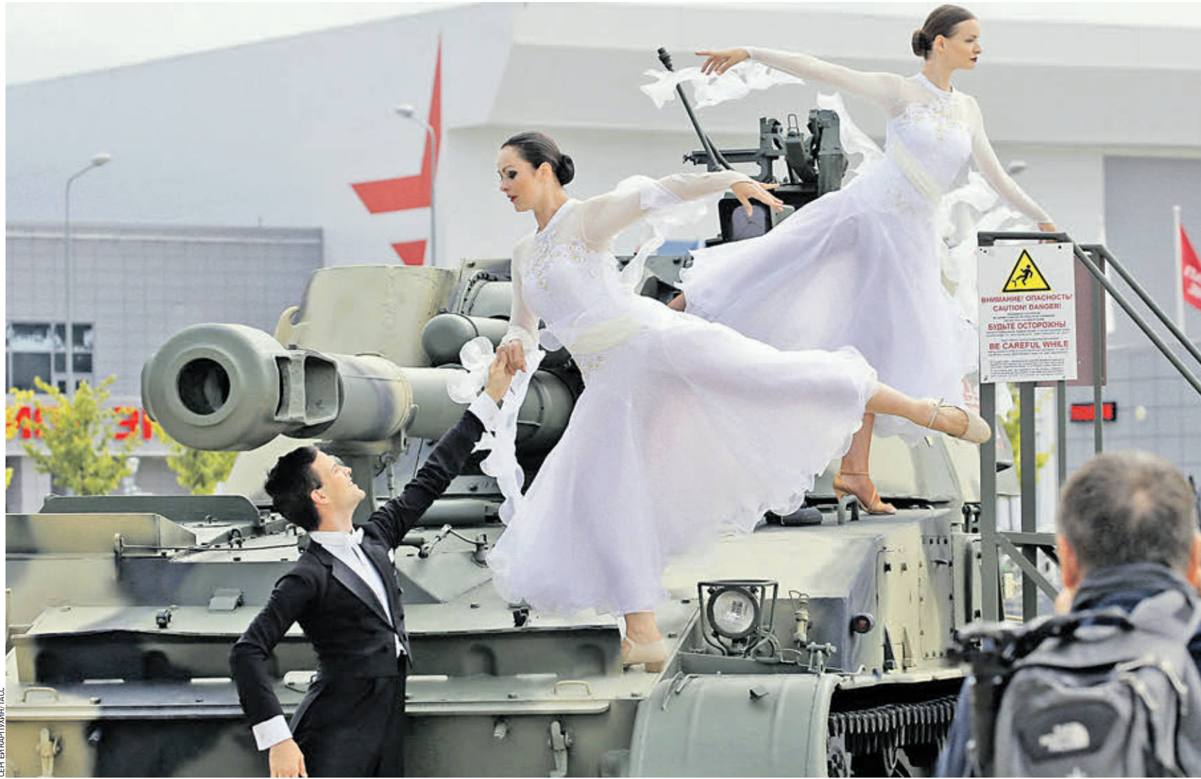
3 августа 2019 года. Танцоры на броне самоходной 152-мм гаубицы «Анация» во время открытия Армейских международных игр — 2019. Кстати, танцевали здесь не только приглашенные артисты: виртуозные экипажи танков заставили боевые машины исполнить напоминающие балет движения под музыку Петра Чайковского