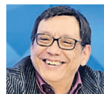
ЕГОР КОНЧАЛОВСКИЙ РЕЖИССЕР, СЦЕНАРИСТ, ПРОДЮСЕР

Относительно технической части российского кино выглядит на уровне Европы, таких кинематографических стран, как Южная Корея. У нас работает много специалистов высочайшего уровня. Да, у нас не хватает масштаба в силу величины нашего рынка. Мы не можем делать «Властелин колец» или «Звездные войны», с одной стороны, в силу бюджетов, с другой — в силу своей не глобалист-