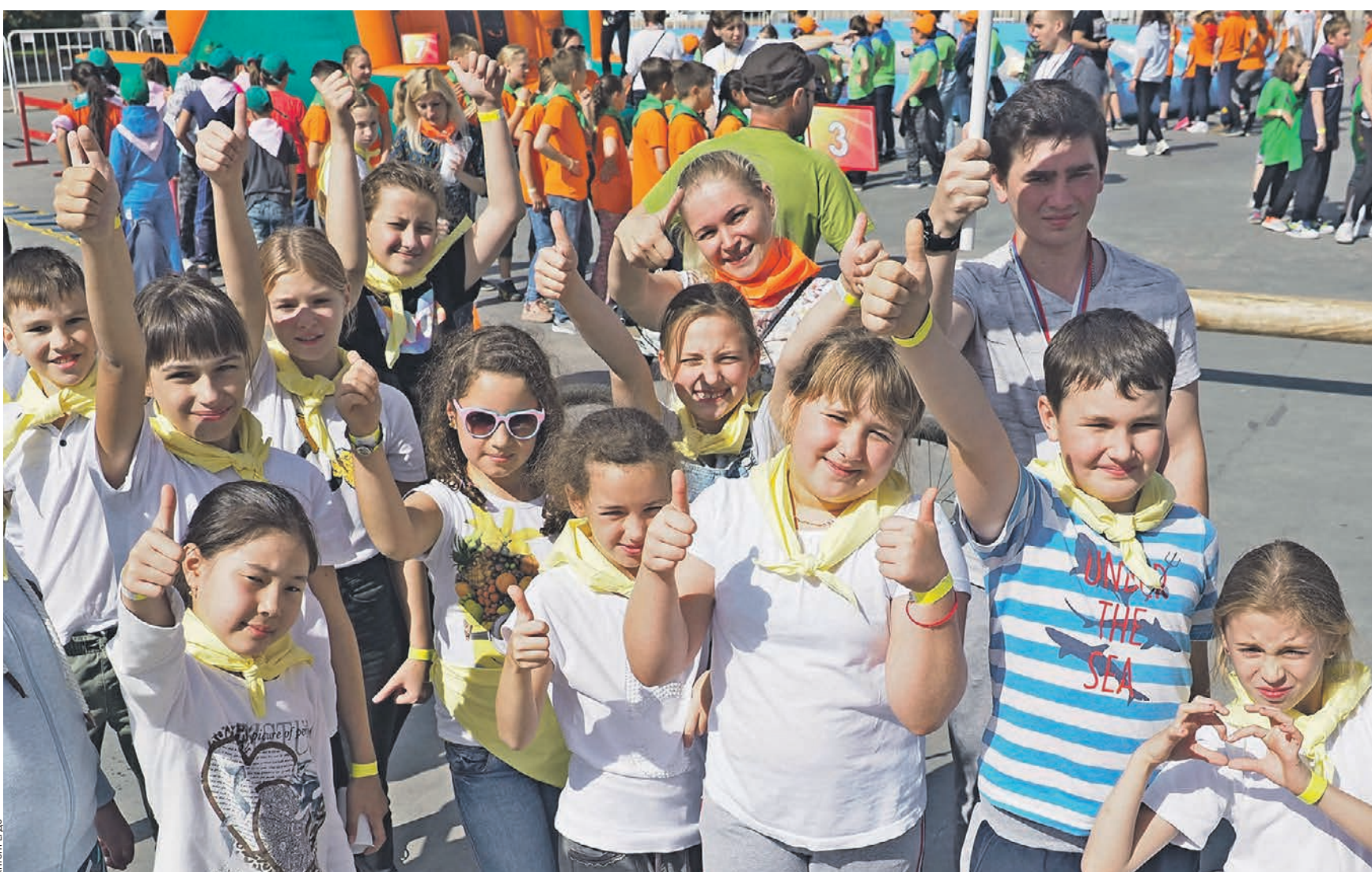
Вчера 12:16 Сборная команда школьников из ТиНАО — победитель фестиваля «Олимп» в парке «Сокольники». Это итоговое мероприятие программы летнего отдыха детей «Московская смена — 2019»

Ну а пока почти 200 ребят на Фестивальной площади парка «Сокольники» проводили беззаботное лето, в котором было столько интересного. Школьный фестиваль «Олимп» не только подвел итоги летнего проекта, но и определил лучшую команду, а вместе с ним и самый спортивный округ столицы. Первое место заняли ребята из самого молодого округа Москвы — ТиНАО. — Мы в победе не сомневаемся! — нескромно признавался один из самых активных ребят в команде победителей