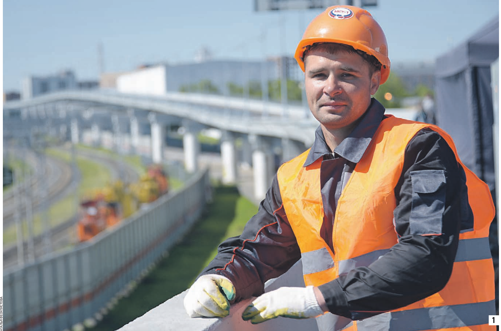
Хорды и рокада столицы