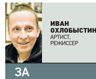
ИВАН ОХЛОБЫСТИН АРТИСТ, РЕЖИССЕР

Сегодня у меня есть мечта когда-нибудь вновь вернуться к служению у престола. Пока есть некоторые дела, в том числе и финансовые, которые мне необходимо завершить, а после этого я отправлюсь служить в какой-нибудь небольшой храм. О моем желании знают многие представители Церкви, и, насколько я знаю, никаких возражений у них по этому поводу нет. Так что Русская православная церковь и христианство вообще против искусства не выступают и никогда не выступили.