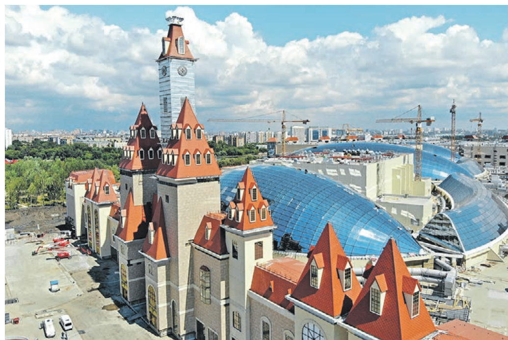
8 июля 11:35 Строительство парка «Остров Мечты» находится на финишной прямой: готов конструктив здания, начались заключительный этап отделочных работ и установка аттракционов

Строительство моста через Кожуховский затон и парк «Остров Мечты» планируют завершить к концу 2019 года. Корреспондент «ВМ» побывал на объекте и выяснил, какие транспортные задачи поможет решить новый мост.