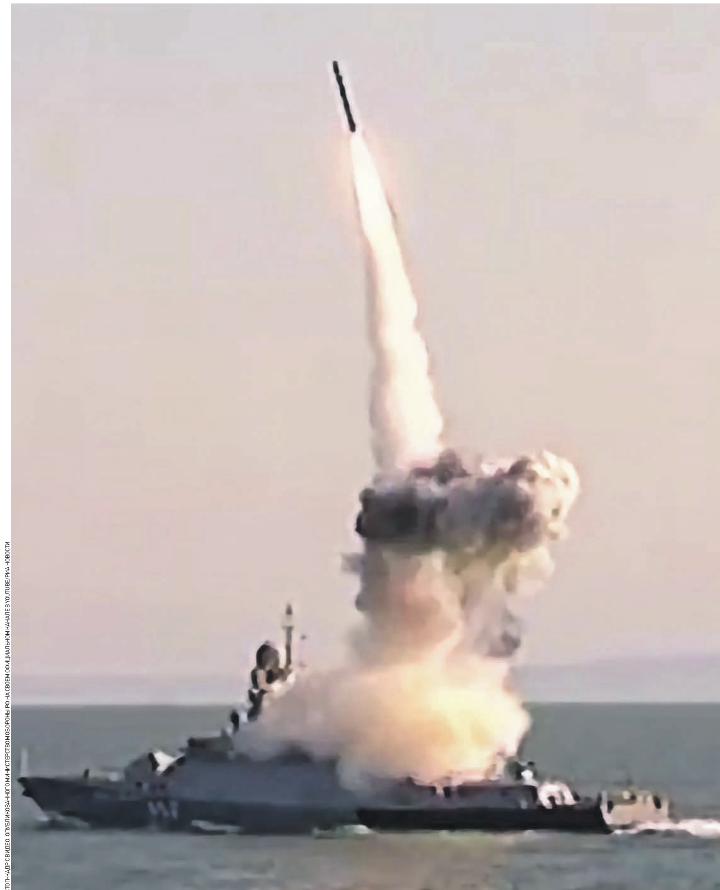
9 сентября 2016 года. Пуск из комплекса «Калибр» кораблем Каспийской флотилии в рамках учения «Кавказ-2016»