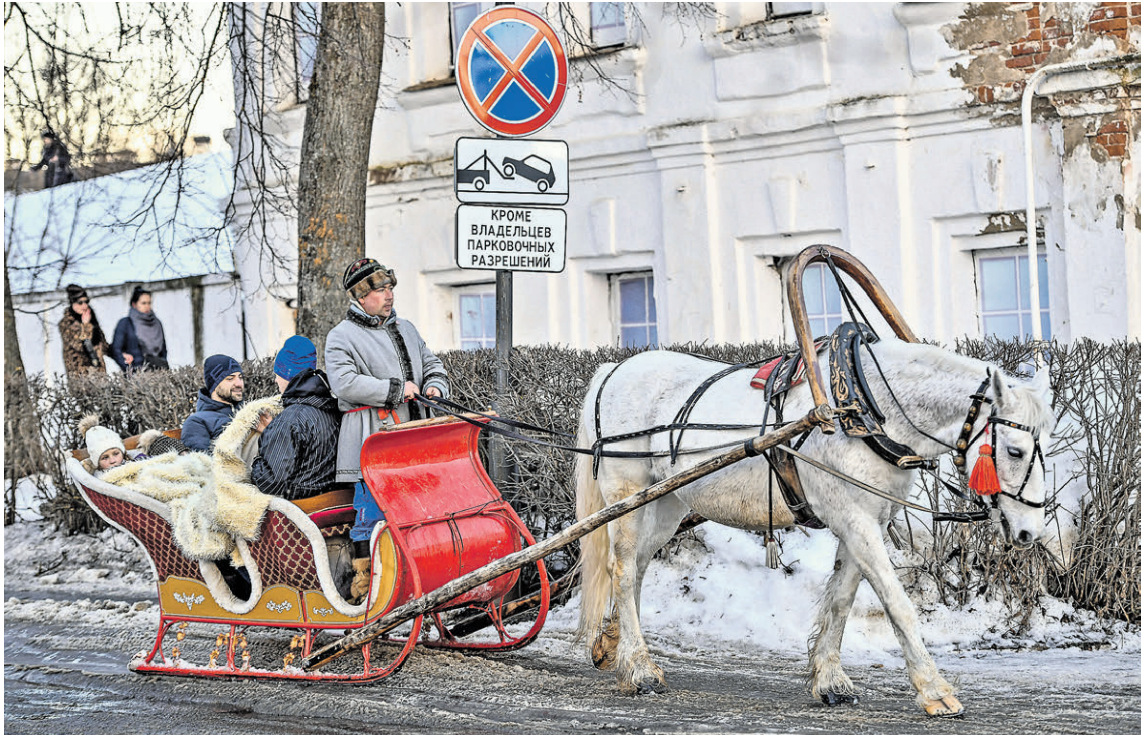
9 марта 2019 года. Участники праздничных гуляний в Суздале, посвященных провадам Широкой Масленицы