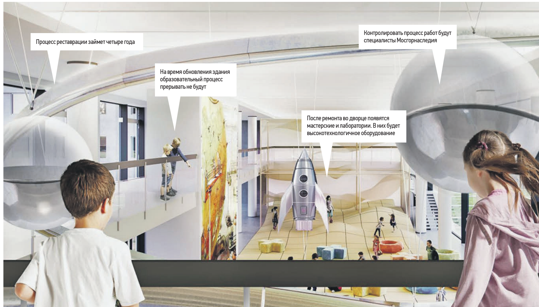
Процесс реставрации займет четыре года

Дизайн-проект реставрации Московского Дворца пионеров на Воробьевых горах