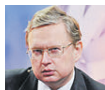
МИХАИЛ ДЕЛЯГИН ДИРЕКТОР ИНСТИТУТА ПРОБЛЕМ ГЛОБАЛИЗАЦИИ

ты труда. Они получают зарплату, но неофициально, а без справки о доходах вы кредит в банке не получите. Отсюда вытекает и рыночная ситуация, и необходимость микрозаймов. Человек идет и получает их там, где ему это дают сделать. Закрывать МФО только потому, что кто-то в обход законодательства переплатил долг коллекторам — это, конечно, «выдающийся» пример. Я могу также привести и варианты неадекватного поведения классических банков. Они также могут не выполнять требования законодательства. На мой взгляд, выступления депутатов со словами о том, что микрофинансовые организации кому-то вредят, на деле вредят только самим законодателям и их репутации.