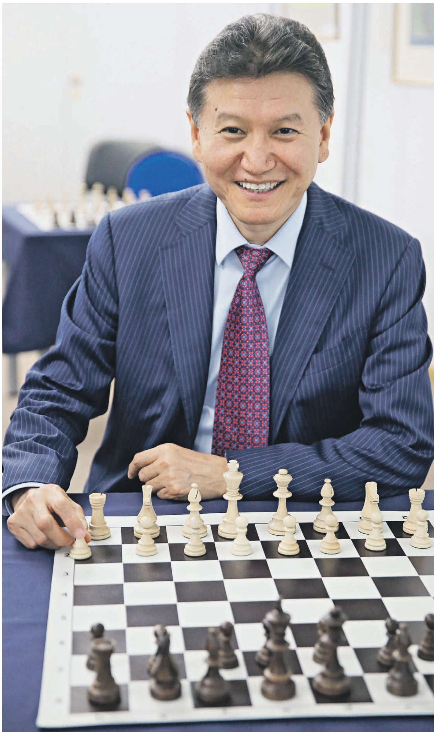
26 мая 2016 года. Кирсан Илюмжинов во время мастер-класса от шахматной школы им. М. Ботвинника при Московском дворце пионеров. Мероприятие проходило в Третьяковской галерее в Лаврушинском переулке

В то время я выступил с идеей-проектом «Умный миллиард», который продвигаю и по сей день. Признаюсь, он носит даже больше политический характер, чем спортивный. Поясню. Как президенту мировой шахматной федерации мне приходилось постоянно бывать в разных странах. Даже в какой-то год установил рекорд — посетил 100 разных стран мира.