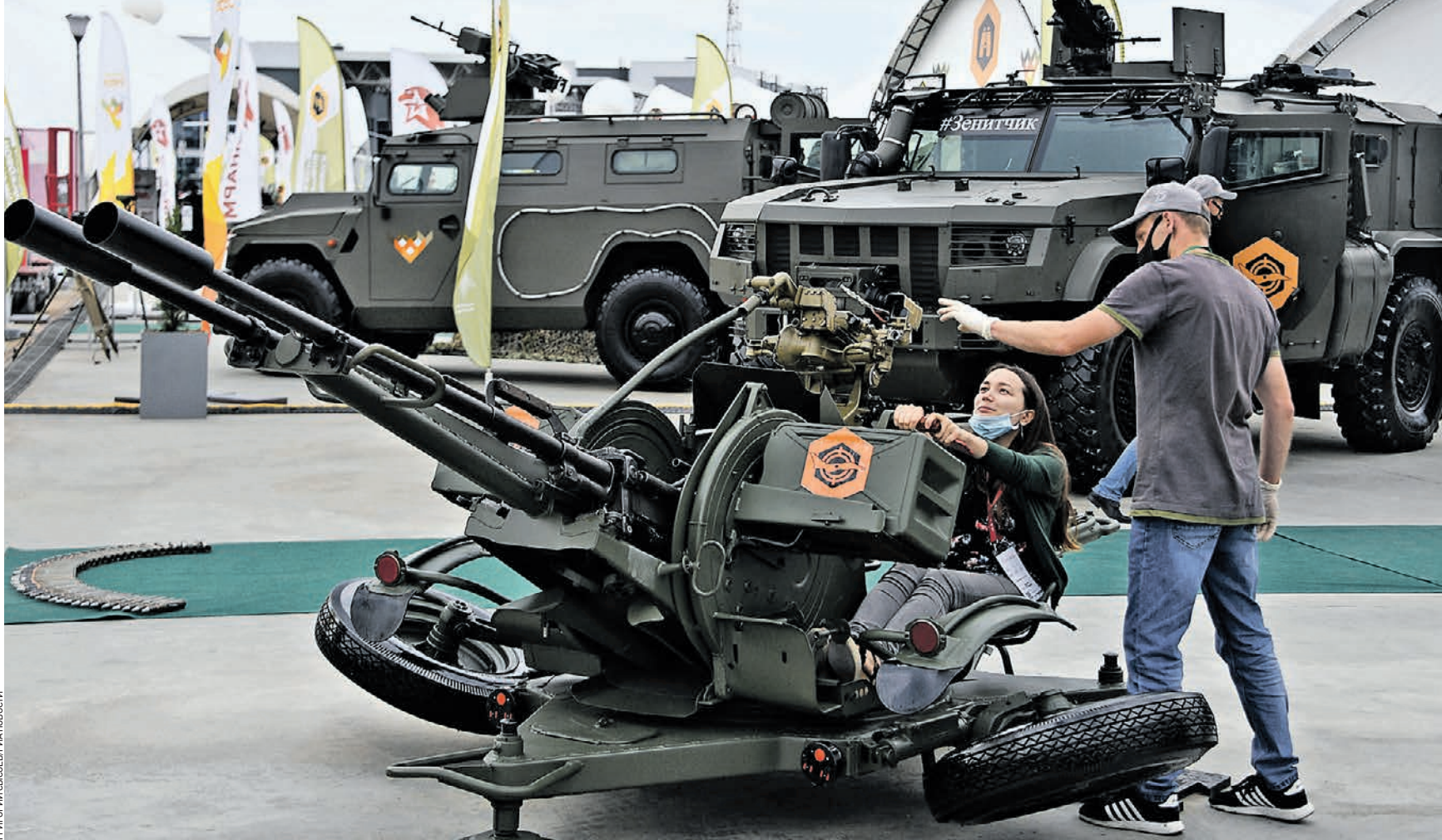
Вчера 09:57 Посетители военно-технического форума «Армия-2020» знакомятся с возможностями модернизированной зенитной установки ЗУ-23, которая с успехом может бить как по наземным, так и по воздушным целям

оборона Вчера в рамках проекта «Армия-Онлайн.РФ» предприятия Военно-промышленного комплекса представили свои разработки представителям Министерства обороны России.