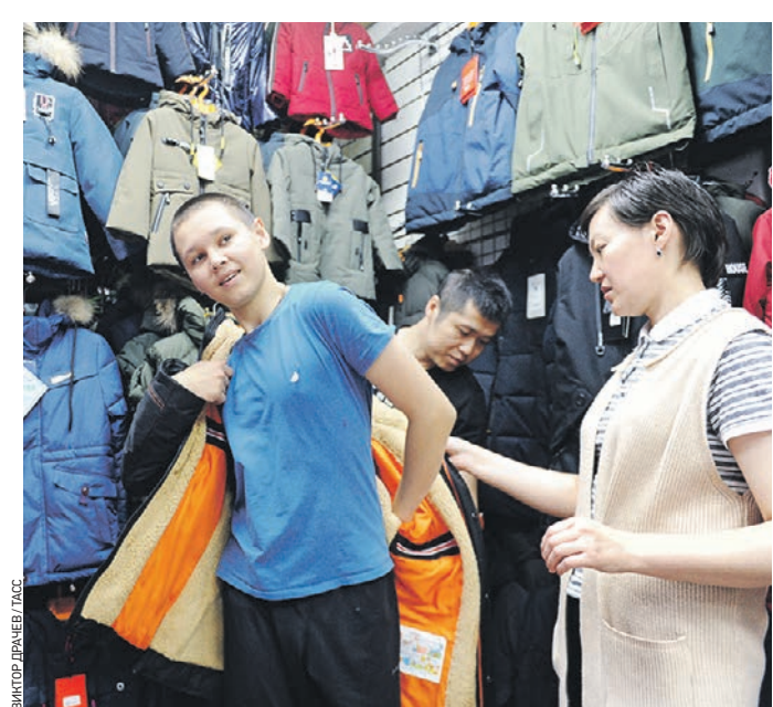
31 августа 2019 года. Продажа одежды на рынке «Садовод». Здесь нередко одеваются модники, мечтающие сэкономить

Российский рынок люксовой одежды, обуви, часов и аксессуаров в этом году упадет на 20–25 процентов. Такой прогноз дают аналитики консалтинговой компании Bain & Co.