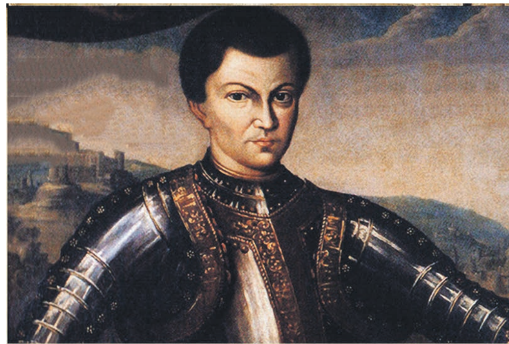
Миниатюра с изображением Лжедмитрия I (время создания неизвестно). Самозванец царствовал менее года и был убит в ходе боярского бунта