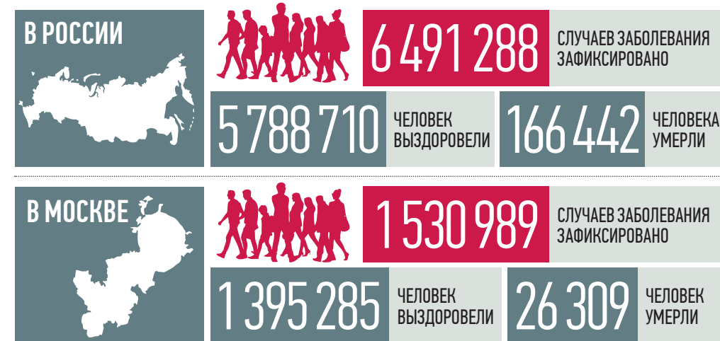
По данным стопкоронавирус.рф и mos.ru на 19:00 10 августа

Необходимое для заражения количество вирусных частиц для варианта «дельта» ниже, чем для уханьского штамма, в 10 раз, поэтому этот вариант распространяется быстрее, сообщил вчера гендиректор Государственного научного центра вирусологии и биотехнологии «Вектор» Роспотребнадзора Ринат Максисов.