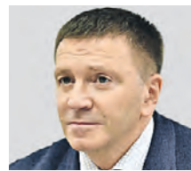
ВЛАДИМИР СОЛДУНОВ ПРЕДСЕДАТЕЛЬ ВСЕРОССИЙСКОГО ОБЩЕСТВА АВТОМОБИЛИСТОВ

Предложение это никому не нужно. Оно будет абсолютно неэффективным. Автомобилисты, особенно те, которые работают в перевозках, так