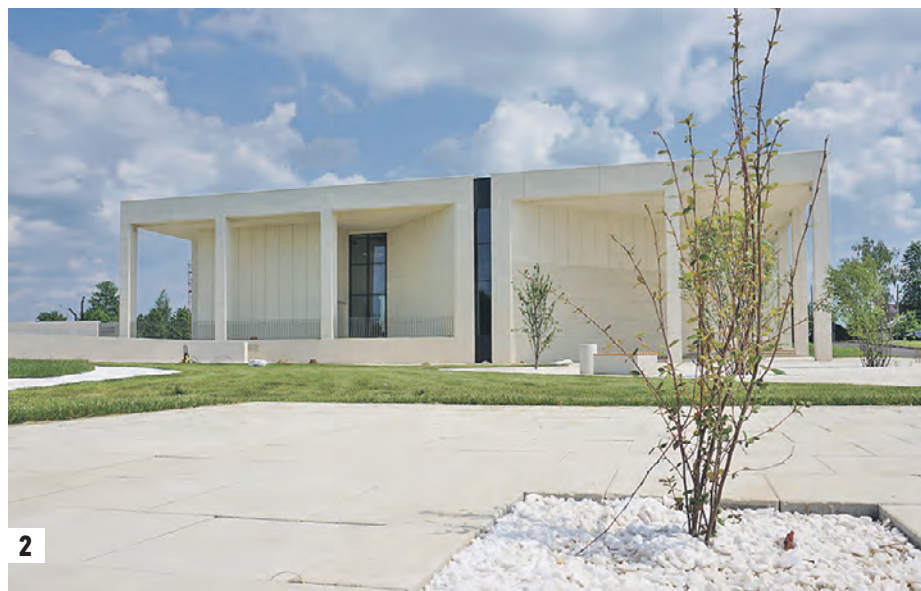
29 ноября 1941 года, деревня Петрищеве, около 10:30 утра. Зою Космодемьянскую вводят к месту казни. На ее груди табличка — «поджигатель домов» (1) Здание нового музейного комплекса «Зоя», открытого 8 мая 2020 года. Музей рассказывает не только о подвиге Зои, но и об обороне Москвы (2) Комсомольский билет Зои Космодемьянской (3)