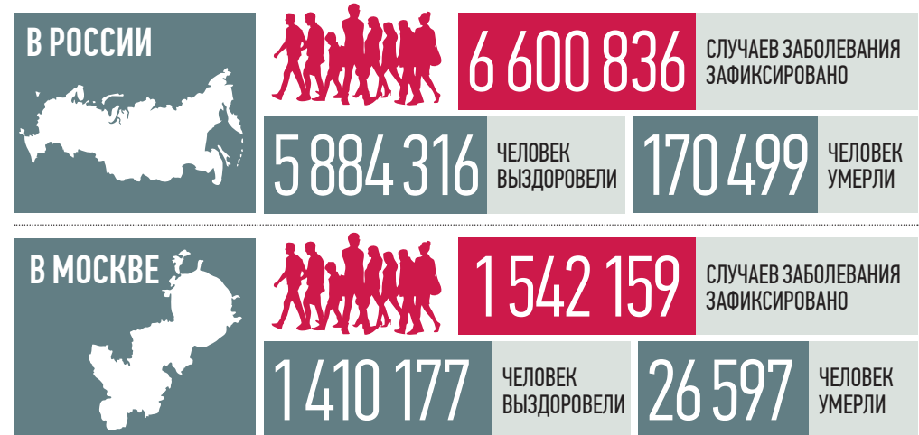
По данным стопкоронавирус.рф и mos.ru на 19:00 15 августа

У детей в 90 процентах случаев коронавирусная инфекция протекает в легкой бессимптомной форме. Но в оставшихся 10 процентах у детей от 7 до 10 лет заболевание наблюдается в средне-тяжелой и тяжелой формах, сообщил вчера главный педиатр Департамента здравоохранения Москвы Исмаил Османов.