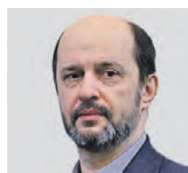
ГЕРМАН КЛИМЕНКО ПРЕДСЕДАТЕЛЬ СОВЕТА ФОНДА РАЗВИТИЯ ЦИФРОВОЙ ЭКОНОМИКИ

ных соцсетей проводят политику двойных стандартов: во всех странах они почему-то считаются с законодательством, а в нашей — нет. Еще мы замечаем, что Государственная дума пытается добиться от руководителей социальных сетей исполнения решений Роскомнадзора, но это, к сожалению, не всегда получается. Так что тех, кто не хочет придерживаться закона, действительно стоит запретить.