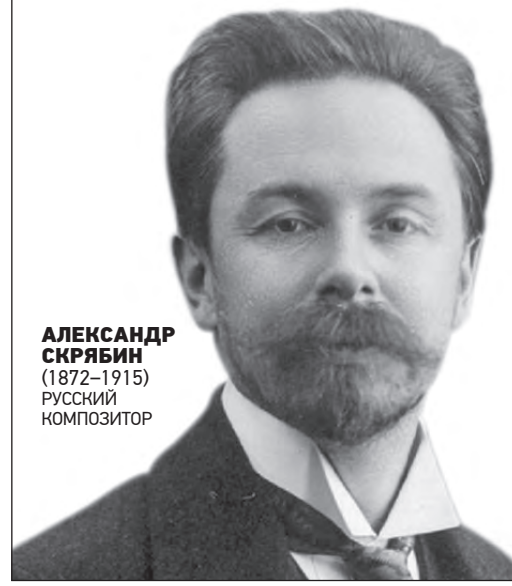
АЛЕКСАНДР СКРЯБИН (1872–1915) РУССКИЙ КОМПОЗИТОР

Завидовать — значит признать себя побежденным.