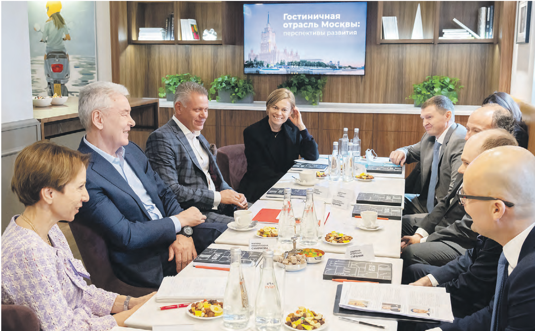
Вчера 13:11 Мэр Москвы Сергей Собянин (второй слева) на встрече с представителями гостиничной отрасли, которая прошла в новом отеле на 1-й Брестской улице. Во время беседы глава города обсудил с бизнесом текущее положение индустрии и ее дальнейшее развитие

Программа стимулирования За пределами Третьего транспортного кольца появится 19,5 тысячи рабочих мест.