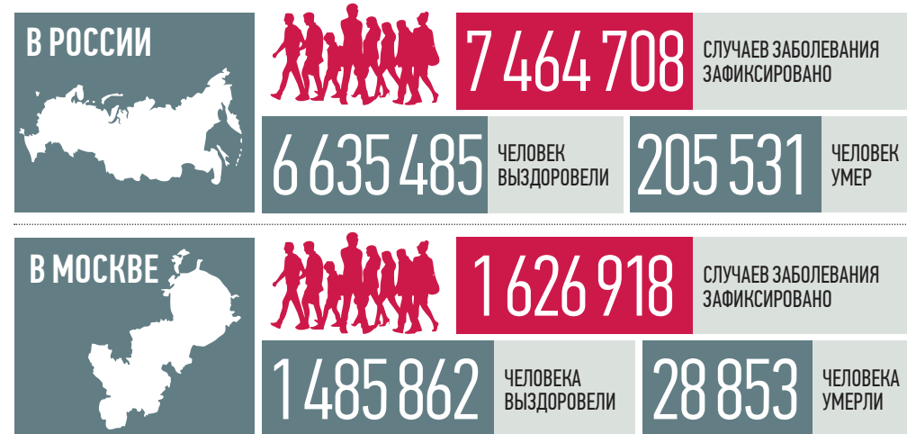
По данным стопкоронавирус.рф и mos.ru на 19:00 28 сентября

Отечественные вакцины для профилактики коронавирусной инфекции «Спутник V» и «КовиВак» на данный момент демонстрируют большую эффективность в борьбе со штаммом «дельта», чем их зарубежные аналоги, заявил вчера президент Российской академии наук Александр Сергеев.