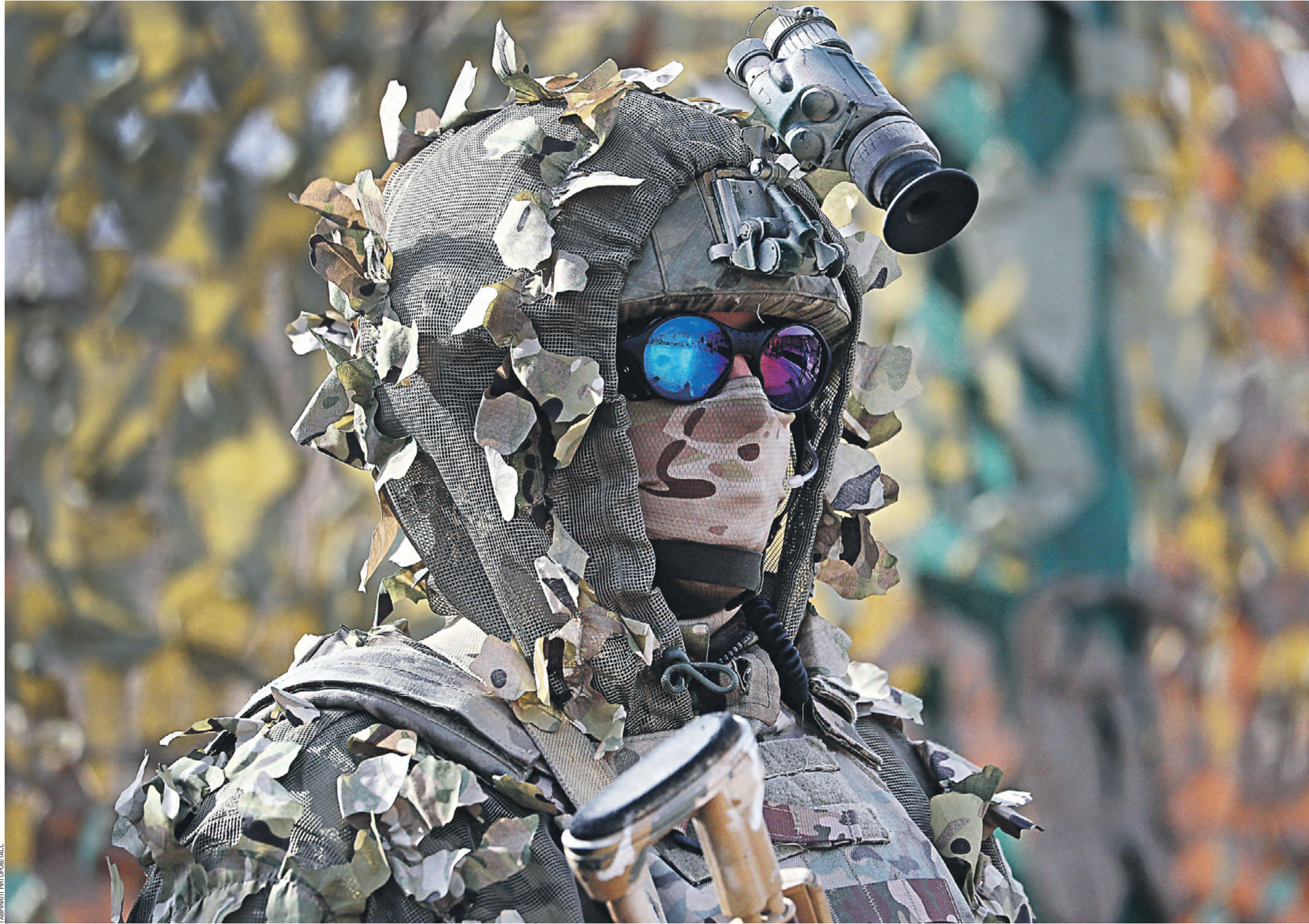
23 сентября. Военнослужащий демонстрирует обмундирование и технику на выставке вооружения во время учений «Мирная миссия-2021»

Силы условных террористов разбиты бескомпромиссным натиском войск союзных стран