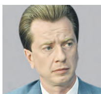
ВЛАДИМИР БУРМАТОВ ПРЕДСЕДАТЕЛЬ КОМИТЕТА ГОСУДАРСТВЕННОЙ ДУМЫ РОССИИ ПО ЭКОЛОГИИ И ОХРАНЕ ОКРУЖАЮЩЕЙ СРЕДЫ

Я полностью поддерживаю регистрацию домашних животных. В первую очередь таким образом будет значительно легче найти потерявшегося питомца. С другой стороны, если гражданин выбросил животное на улицу, будет проще привлечь его к ответственности. Таким образом сократится количество бездомных кошек и собак. За них будут отвечать конкретные люди. Также будет проще собрать доказательную базу в случаях, когда владельцы собак плохо следят за своими питомцами и те нападают на прохожих. Я думаю, регистрация нужна прежде всего не самим животным, а именно людям. Главное — рассмотреть ситуацию с разных сторон, выделить все плюсы и минусы и принять верное решение.