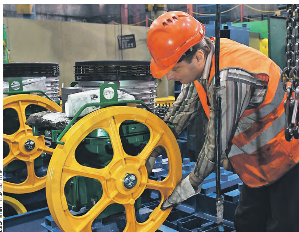
23 декабря 2020 года. Одно из производств среднего бизнеса, лифтостроительный завод в Щербинке, может застраховать свои риски с помощью банковских инструментов

Опцион CAP позволяет уйти от риска значительного повышения КС и других индикаторов, не ограничивая клиента в суммах и сроках. Что он дает клиенту? Опцион CAP (процентный опцион) — инструмент хеджирования, страхования рисков. Соглашение CAP устанавливает лимит ставки по кредитному договору, и выше этого лимита она не поднимется. Иначе говоря, опцион CAP позволяет компании зафиксировать любую верхнюю границу индикатора на любой срок и на любую сумму. Компания платит премию при заключении сделки, а страховой случай — повышение КС. Если КС стабильна или снижается, то предприниматель получает выгоду. Например, в декабре прошлого года крупный промышленный холдинг, производящий оборудование для металлургии, получил в нашем банке кредит в размере 700 миллионов рублей и заключил сделку по процент-