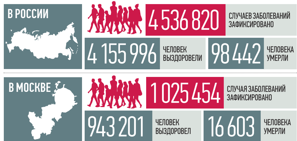
По данным стопкоронавирус.рф на 11:30 марта