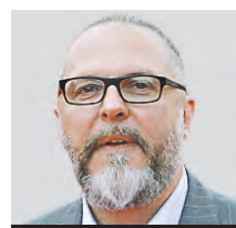
ЮРИ ГРЫМОВ РЕЖИССЕР, СЦЕНАРИСТ

Между тем зритель готов потреблять такую продукцию — условно неамериканскую, он способен воспринимать и другой, не голливудский художественный язык. Доводилось этому — нынешняя популярность театра. В нашем театре практически всегда аншлаги, и среди зрителей много молодежи. Если она ходит на русские спектакли, то пойдет и на русское кино, если его правильно сделать. На мой взгляд, необходима перестройка всей отечественной киноиндустрии. Ну, например, изменение схемы его финансирования. Пусть «успешные» продюсеры берут в бан-