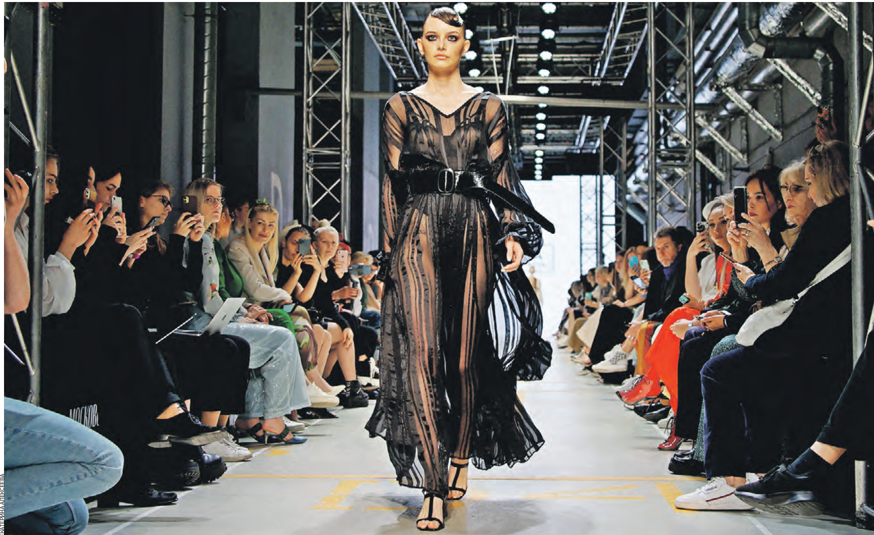
Вчера 15:09 Торжественное открытие первой столичной Недели моды в парке «Зарядье». Дефиле новой коллекции одежды известного российского бренда прошло в подземном паркинге концертного зала, который организаторы мероприятия временно превратили в место подиумных показов