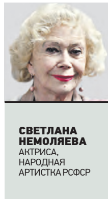
СВЕТЛАНА НЕМОЛЯЕВА АКТРИСА, НАРОДНАЯ АРТИСТКА РСФСР

Только что вернулась с кинофестиваля в Нальчике и скажу, что новых интересных фильмов у нас масса. Есть очень интересное киргизское и якутское кино. Но прокатчики их не берут. Почему? Потому что эти фильмы не делают кассу. Дело в том, что в последние десятилетия изменился зритель. Раньше в кино ходили буквально все — от детей до пенсионеров, а сейчас в основном тинейджеры. А им нужны «движуха» и спецэффекты, чтобы все мелькало. А в России такое кино снимают редко. Мы все-таки остаемся страной высокой культуры, мы хотим, чтобы кино было со смыслом, чтобы затрагивало струны души. А это кино по определению некоммерческое. Чтобы оно стало коммерческим, должен измениться зритель: он должен как минимум начать читать, стать более развитым. Нам придется изменить и сам кинематограф. Возродить, условно говоря, студию детских и юношеских фильмов имени Горького, начать снимать кино для тинейджеров — о том, что их волнует. Возможно ли это? Я не знаю.