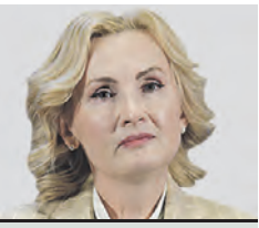
ИРИНА ЯРОВАЯ председатель попечительского совета акции «Свеча памяти», заместитель председателя Госдумы

▲ АКЦИЯ «СИРЕНЬ ПОБЕДЫ» И «ЖИВАЯ ПАМЯТЬ» → стр. 3