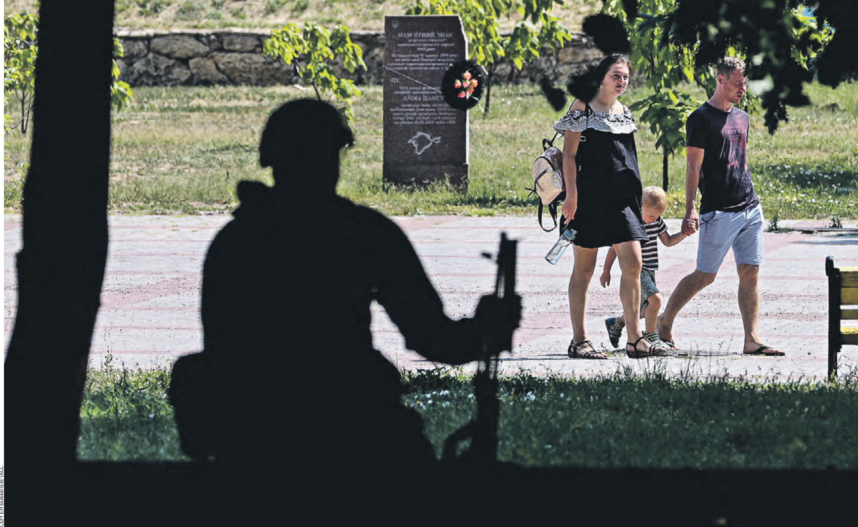
10 июля 17:07 Военнослужащий Вооруженных сил РФ (на первом плане) на территории парка Херсонская Крепость. Местные жители не боятся гулять по зеленой зоне, ведь за безопасностью следят российские солдаты