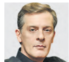
ЮРИЙ АРТ ЭКСПЕРТ КОМИТЕТА ГОСУДМУ ПО ФИНАНСОВОМУ РЫНКУ

Прощай, кола! Будем пить свое Российские компании наращивают производство газированной воды. Об этом сообщил оператор системы маркировки «Честный знак» — Центр развития перспективных технологий. В июне в бутылки разливается 8,7 миллиона (!) литров воды с газом ежедневно. Это на 63 процента больше, чем в апреле нынешнего года. Дефицит углекислого газа, связанный с плановым ремонтом на некоторых заводах, летом должен закончиться, и объемы производства, как планируется, вновь вырастут.