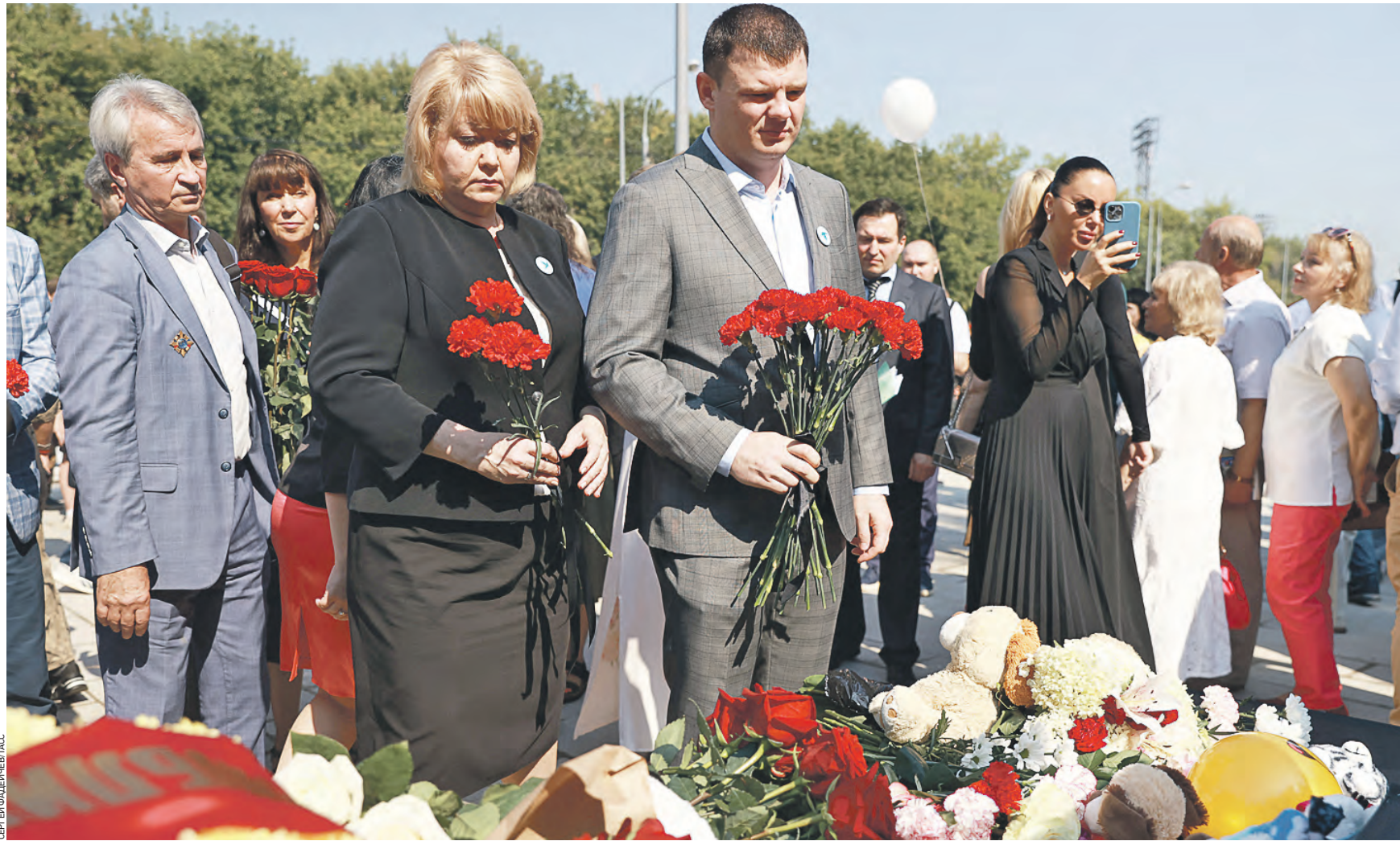
Вчера 09:52 Посол ДНР в России Ольга Макеева (на переднем плане) пришла на площадь ДНР в Москве, чтобы почтить память детей, погибших на Донбассе