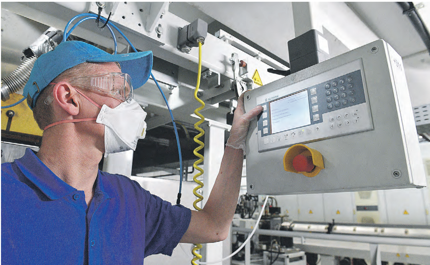
7 июля 2022 года. Несколько сотен разновидностей нетканого полотна позволяют выпускать современные производственные линии компании «Нетканика»

Стерильное полотно Компания «Нетканика» выпускает более одного миллиарда квадратных метров нетканых материалов в год! Если для наглядности сравнить эту цифру с площадью футбольного поля по стандартам FIFA, получится примерно 140 тысяч таких полей! Впрочем, астрономические на первый взгляд объемы продукции легко объясняются высоким спросом — ведь фирменные материалы используют затем в легпроме в качестве сырья для различных средств гигиены, одноразовых средств индивидуальной защиты (масок и защитной одежды медперсонала), тепло-, влаго- и ветрозащитных мембран и многого другого.