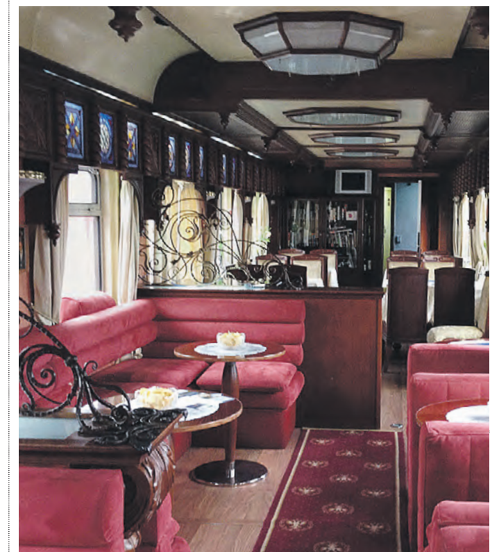
1 июля 2020 года. Интерьер туристического поезда «Золотой орел» создан столичной компанией

В настоящий момент в эксплуатации находится более 370 вагонов повышенной комфортности и вагонов-ресторанов, созданных компанией «Циркон Сервис». Это вагоны для известных туристических фирм и фирменных поездов «Золотой орел», «Северное сияние», «Александр Невский», «Ураль», «Столичный экспресс», «Татарстан», «Красная стрела», «Гранд Экспресс», а также для поездов международных направлений. В купе таких вагонов есть широкий диван-кровать, кресло, шкаф, кондиционер, а также ванная комната с подогреваемым полом и душевой кабиной, чтобы путешествие было в радости.