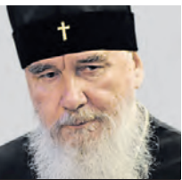
КЛИМЕНТ МИТРОПОЛИТ КАЛУЖСКИЙ И БОРОВСКИЙ