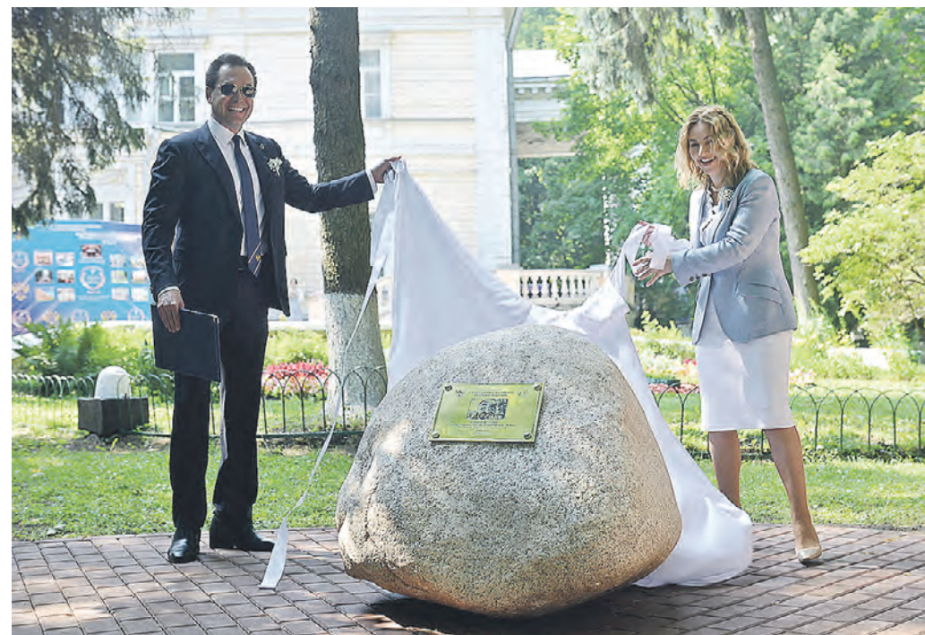
Вчера 11:31 Директор ФНЦК РР Андрей Гречко и замминистра науки и высшего образования России Наталья Бочарова открывают памятный знак в честь 100-летия санатория «Узкое»