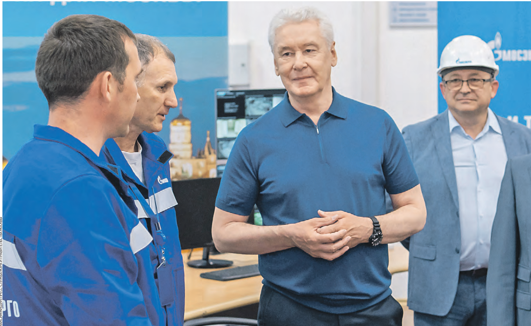
Вчера 13:10 Мэр Москвы Сергей Собянин (в центре) поздравил сотрудников «Мосэнерго» со 135-летием предприятия. Глава города обсудил с энергетиками подготовку к предстоящему отопительному сезону. Все работы завершат к сентябрю

Сергей Собянин посетил ТЭЦ-26 в районе Западного Бирюлево. Здесь энергетики и глава города обсудили подготовку столицы к предстоящему отопительному сезону. Поговорка о санях летом для энергетиков актуальна всегда. — На самый пик лета приходится активная фаза подготовки города к осенне-зимнему периоду, подготавливается огромный жилой фонд и фонд капитальных строений, — отметил Сергей Собянин. — На контроле энергетиков — порядка 70 тысяч объектов: это десятки тысяч сетей, тепло-, электро- и водоснабжение, а также газовое хозяйство. Мэр отметил, что «сердцем» всей коммунально-энергетической системы является «Мосэнерго» и мощности, которые обеспечивают тепло и электричеством столицу. В планах на этот год — ремонт инженерных систем более 1,7 тысячи жилых домов. Но, по словам энергетиков, все подготовительные работы к предстоящему отопительному сезону идут по графику и завершатся 1 сентября. Кроме того, в городе в рамках подготовки к зиме запланиро-