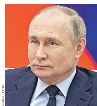
предпринимателей и самозанятых.

Вчера президент России Владимир Путин (на фото) принял участие в заседании наблюдательного совета президентской платформы «Россия — страна возможностей», где высказался по многим актуальным вопросам.