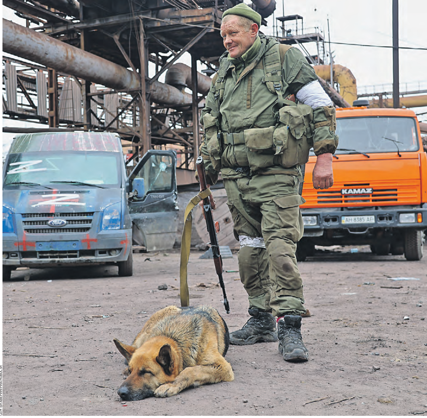
16 апреля 14:46 Военнослужащий Народной милиции ДНР с собакой на освобожденной территории Металлургического комбината имени Ильича в Мариуполе