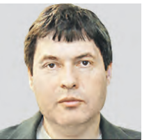
АЛЕКСАНДР ЛОСОТО ОБОЗРЕВАТЕЛЬ

Мнение колумнистов может не совпадать с точкой зрения редакции «Вечерней Москвы»