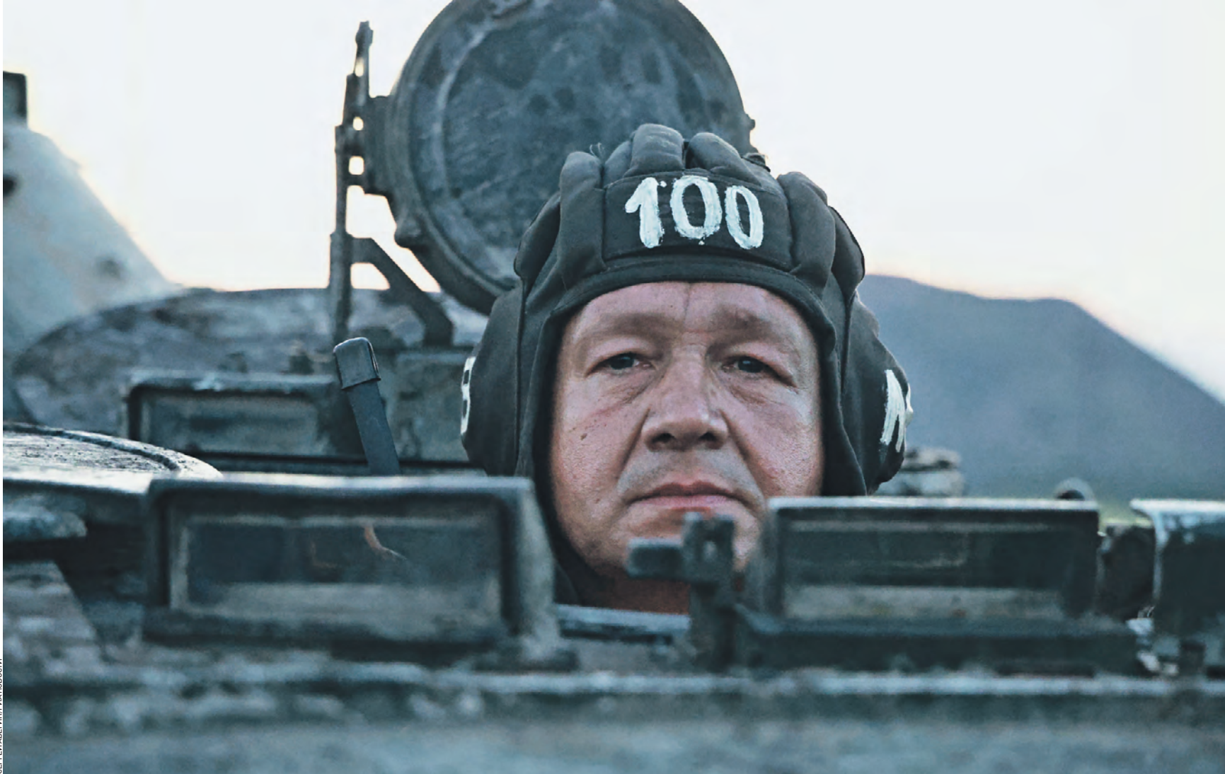
10 августа 2023 года. Водитель-механик добровольческого подразделения «Пятнашка» едет на БТР-82А для отработки слаженности команды на полигоне в ДНР

По словам Конашенкова, удары были нанесены высокоточным оружием большой дальности морского базирования. Он подчеркнул, что цель была достигнута и все назначенные объекты — поражены. Помимо этого, в районе Авдеевки в ДНР был уничтожен склад боеприпасов 53-й механизированной бригады ВСУ. Конашенков добавил, что на Донецком направлении действия подразделений «Южной» группировки войск, при поддержке штурмовой и армейской авиации были успешно отражены шесть атак ВСУ в районах населенных пунктов Белогорка ЛНР, Водяное, Красногоровка и Невельское ДНР. Потери ВСУ, по данным Минобороны России, составили до 150 украинских военнослужащих, два танка, три боевые бронированные машины, пять автомобилей, а также гаубицы: FH-70 производства Великобритании и Мста-Б, уточнили в МО. Также российские средства противовоздушной обороны за сутки перехватили 2 снаряда реактивной системы залпового огня HIMARS и сбили 28 беспилотников ВСУ, об этом сообщили в Министерстве обороны РФ.