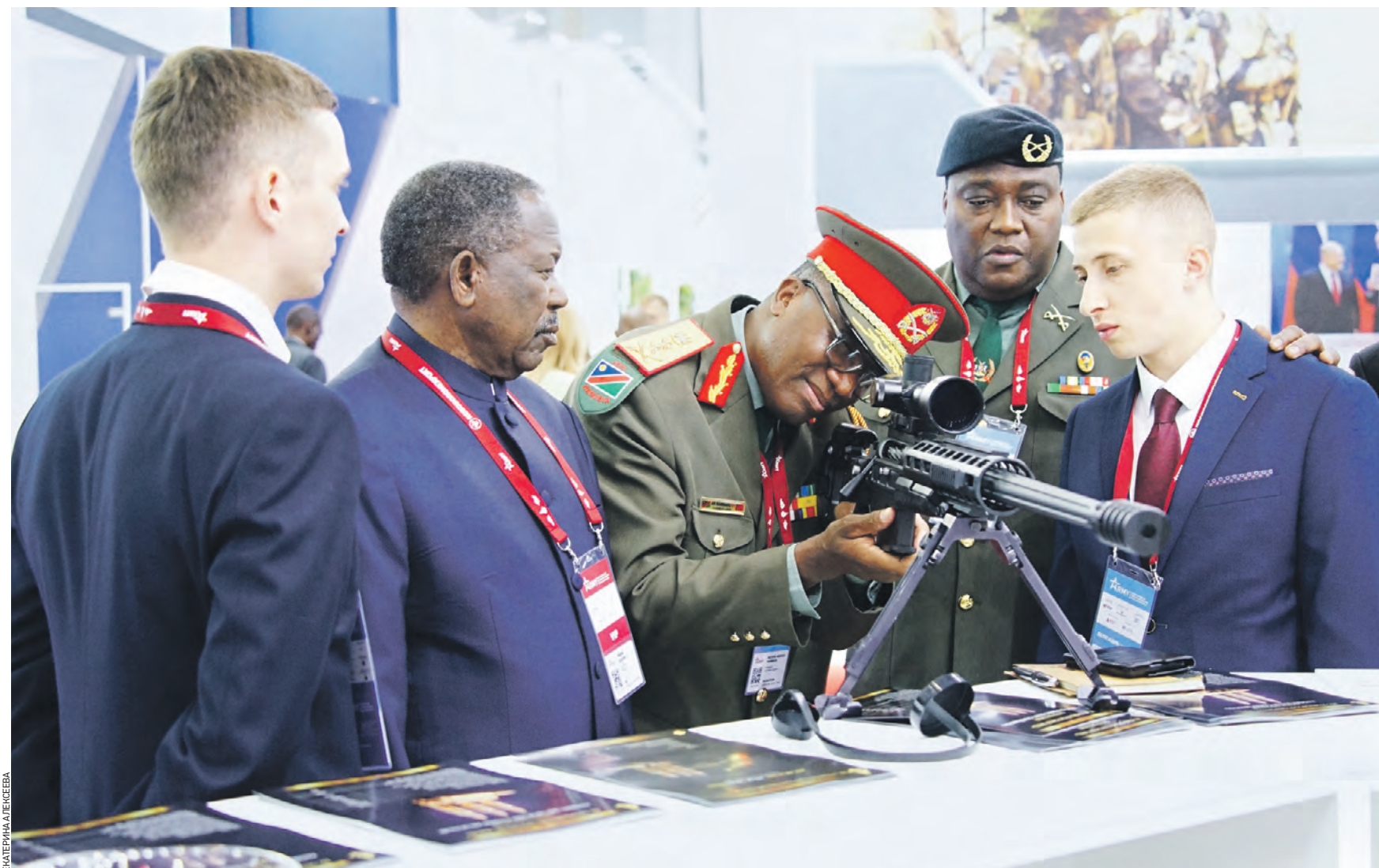
Вчера 12:02 На Международном военно-техническом форуме «Армия-2023» с российским оружием знакомятся иностранные гости. Делегация представителей Министерства обороны Намибии осматривает винтовку Т-5000. В центре бригадный генерал Актофель Нденгу Намбаху

Центром притяжения на всей статической экспозиции форума «Армия-2023» стала площадка Ракетных войск стратегического назначения. Здесь впервые в открыто показе демонстрируется разгонный блок новейшего стратегического комплекса «Авангард». Гиперзвуковой управляемый боевой блок «Авангарда» развивает скорость до 9,5 километра в секунду. Это не имеющее аналогов в мире средство доставки мощных боеприпасов (при необходимости — с ядерной «начинкой») не способно остановить средства противоракетной обороны ни одного государства в мире. Рядом образцы не менее уникальной техники ракетчиков-стратегов — автономная пусковая установка и машина