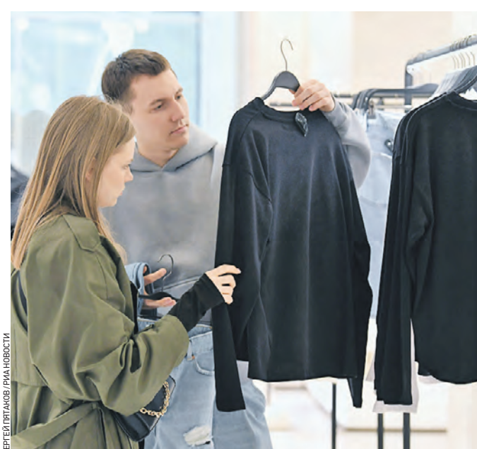
2023 год, Москва. Посетители выбирают сезонную одежду в недавно открывшемся магазине на Неглинной улице

В России снизились цены на одежду. Так, средняя стоимость на пуховики упала в первом полугодии на 15 процентов — до 8,4 тысячи рублей по сравнению с первым полугодием 2022 года.