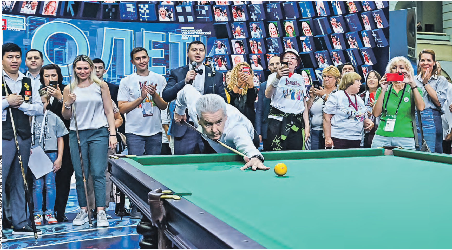
Вчера 17:06 Мэр Москвы Сергей Собянин на площадке Московского урбанистического форума в Гостином Дворе во время встречи с активистами проекта «Московское долголетие» показал свое умение играть в русский бильярд. Знатоки этой игры оценили твердую руку и четкий удар мэра столицы

день мэра В столице открылись еще 10 центров для старшего поколения, заявил вчера мэр Москвы Сергей Собянин на встрече с Ассоциацией клубов долголетия в рамках Урбан-форума.