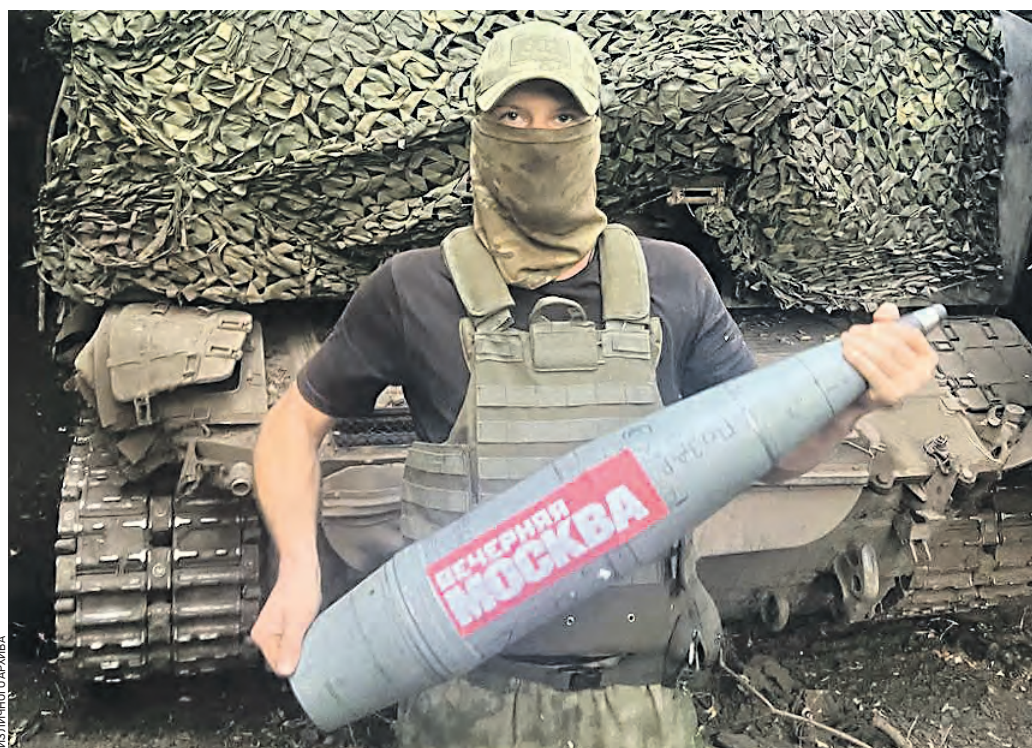
1 октября. Участник специальной военной операции держит в руках снаряд с логотипом главной городской газеты столицы «Вечерняя Москва»