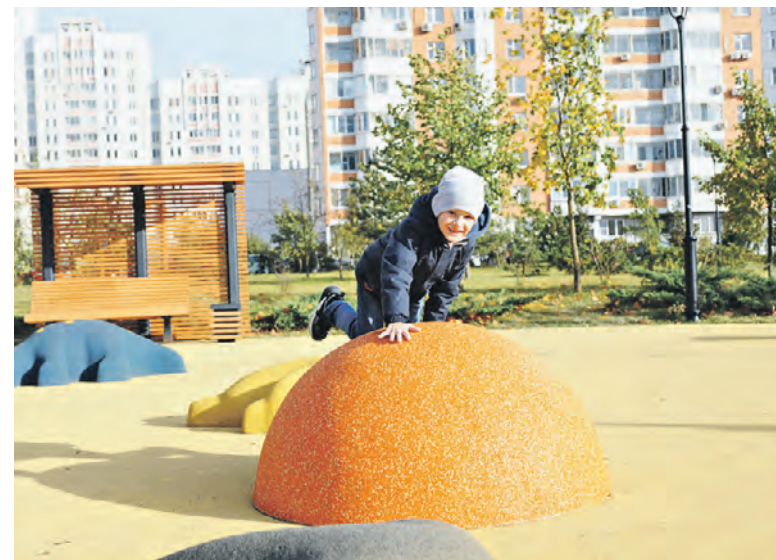
11 октября 2023 года. Детская площадка на Дмитровском шоссе.