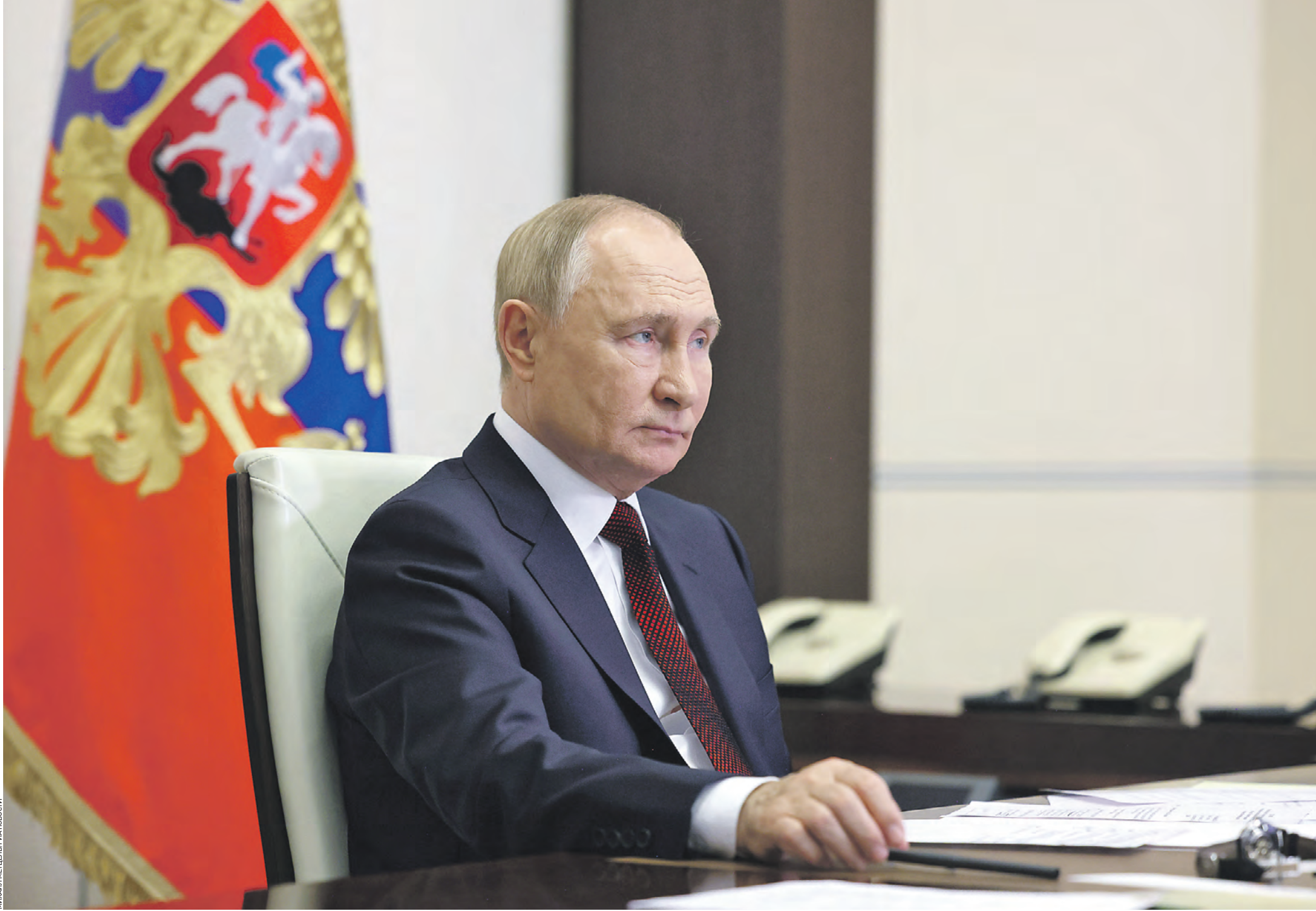
МИХАИЛ ПЕТРОВ / АГЕНТСТВО