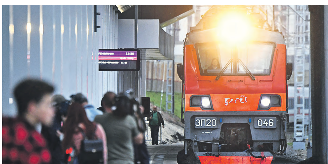
29 мая 2021 года. Пассажирский поезд прибывает к платформе вокзального комплекса «Восточный»

«15-минутный город» — это концепция городского планирования. Главная ее идея — до всех необходимых житейских объектов и услуг можно добраться пешком, на велосипеде или общественном транспорте. Уже сейчас при проектировании новых кварталов мы ставим во главу угла принцип «15-минутного города», стараемся насытить территорию различными социальными объектами, местами приложения труда, непрерывными маршрутами для передвижения пешеходов и пользователей средств индивидуальной