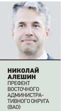
НИКОЛАЙ АЛЕШИН ПРЕФЕКТ ВОСТОЧНОГО АДМИНИСТРАТИВНОГО ОКРУГА (ВАО)