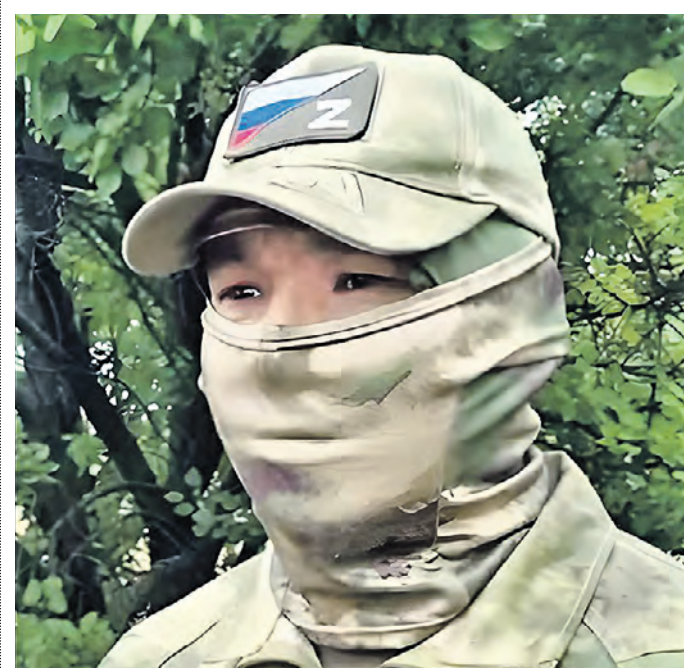
5 октября. Механик-водитель с позывным «Юла» в зоне спецоперации.

— На машине была установлена хорошая станция РЭБ, поэтому дроны меня мало волновали, — поделился «Юла». Достигнув рубежа спешивания, возле лесополосы штурмовики покинули десантное отделение БМП и открыли огонь, защищая опорный пункт противника. — Убедившись, что все успешно высадились, я должен был отъехать в безопасное место. Иначе велика вероятность того, что технику уничтожат. Мои задачи еще не закончились. Штурм в самом разгаре, — вспоминает «Юла». Но смена позиции стала испытанием мужества и профессионализма. Пулеметный огонь врага повредил триплекс БМП, через который «Юла» мог смотреть на дорогу. Видимость снизилась. Люк в такой ситуации не откроешь. — Самое главное — быть готовым ко всему. Я запомнил карту местности и примерно понимал, в какой стороне что находится. Еще важно чувствовать машину. Поэтому, ориентируясь на мелькающие в треснутом триплексе ориентиры, смог выбраться, — поведал «Юла». В итоге наступательные действия закончились успешно. Опорный пункт был зачищен, и на нем закрепились наши бойцы. Вместе с тем удалось добыть образцы ГПРК иностранного вооружения, которые позже передадут в музей.