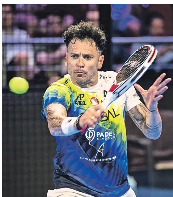
20 сентября. Испанский спортсмен Хуан Мартин Диас на международном турнире по паделу в Москве

на ракеток для игры в падел, добавил Алексей Сорокин. — Сколько такого инвентаря куплено у нас, в России, сложно сказать, но, возможно,