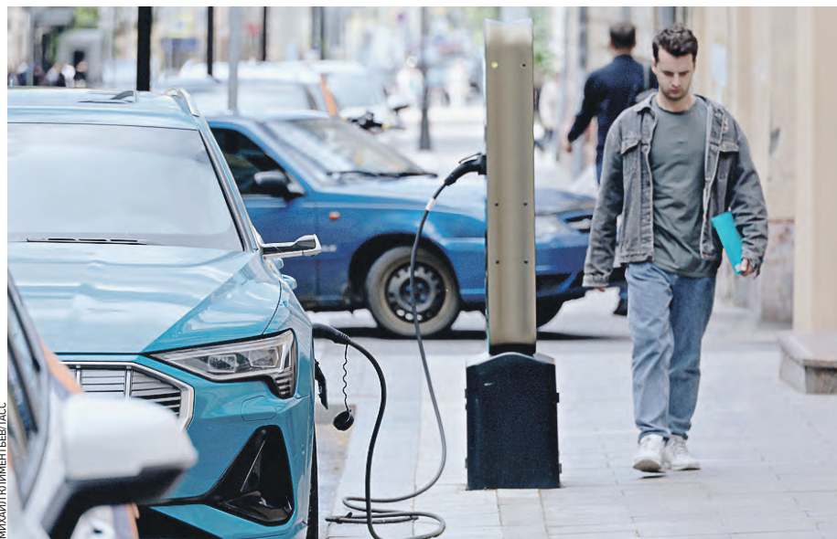
14 июня. Зарядная станция для электромобилей на одной из улиц столицы