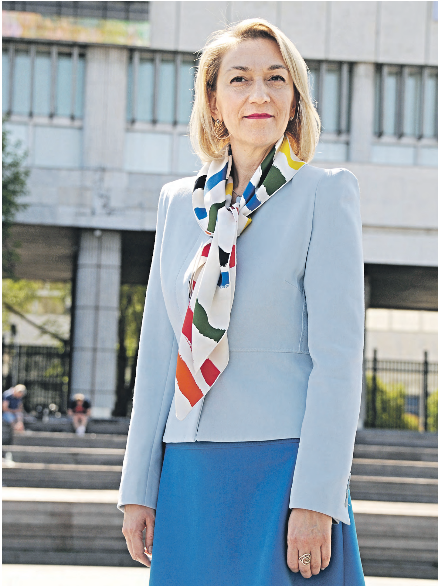
9 августа 2022 года. Председатель Москомархитектуры Юлиана Княжевская на фоне здания Центрального дома художника.

Юлиана Владимировна, не менее обсуждаемая тема — концепция «15-минутного города». Как именно она реализуется в Москве?