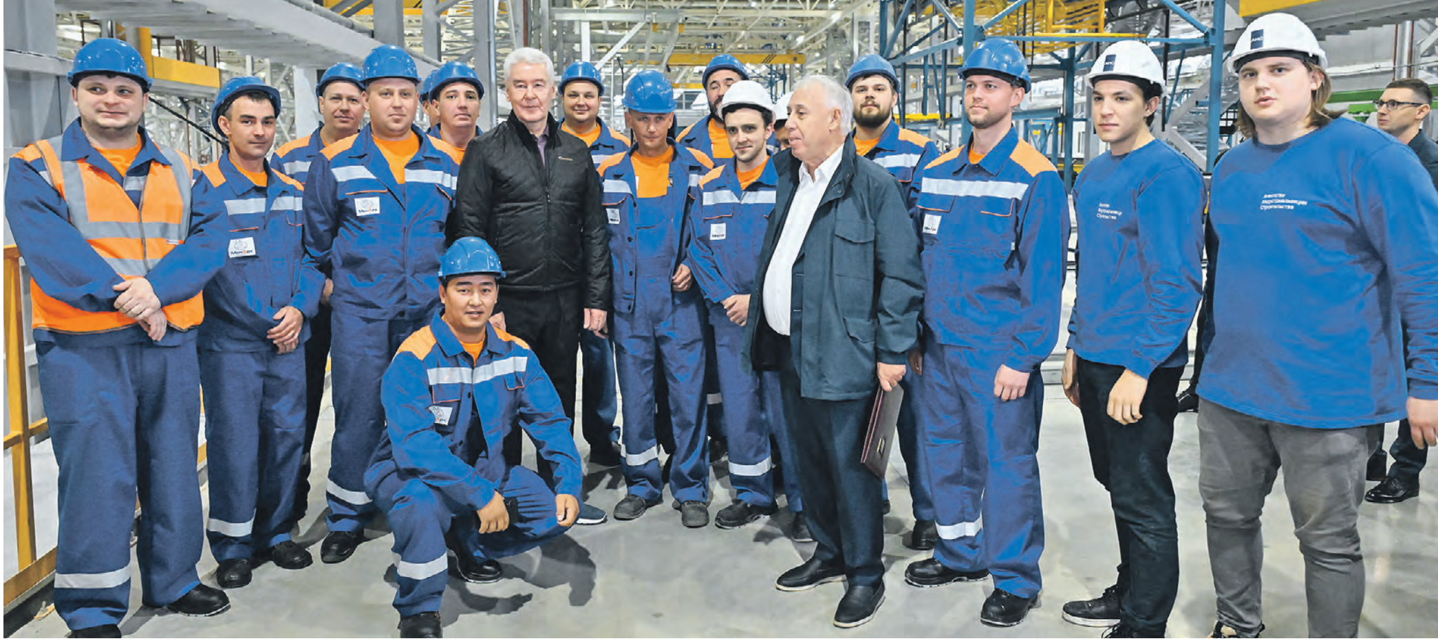
7 октября. Мэр Москвы Сергей Собянин (четвертый слева) поздравил коллектив нового роботизированного завода по производству крупногабаритных жилых модулей с Днем московской промышленности

день мэра Вчера мэр столицы Сергей Собянин посетил новый роботизированный завод по производству крупногабаритных жилых модулей и поздравил коллектив уникального предприятия с Днем московской промышленности.