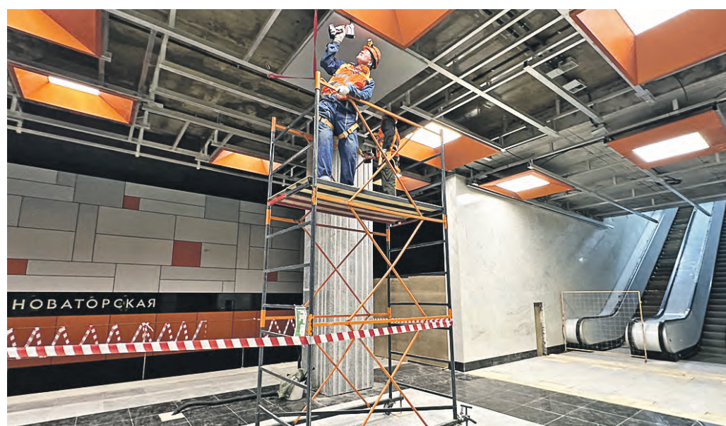
3 октября 2023 года. Строительство станции «Новаторская» Троицкой линии метро выходит на финишную прямую. Ведется отделка платформы

— Строительство станции «Новаторская» находится сегодня на одном из финальных этапов. Монолитные конструкции практически завер-