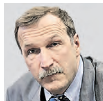
ГЕОРГИЙ БОБТ ОБОЗРЕВАТЕЛЬ

* ИГИЛ — запрещенная на территории Российской Федерации террористическая организация.