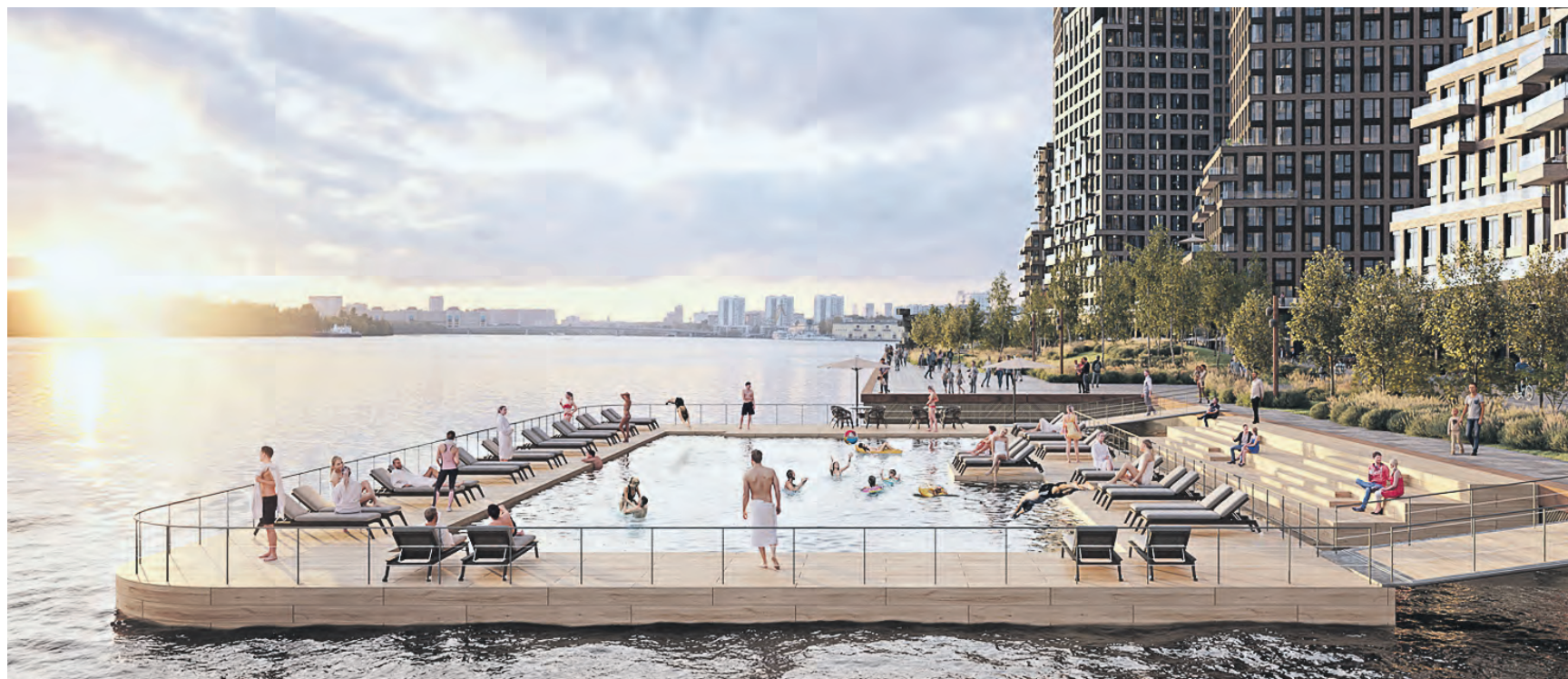
Проект жилого комплекса в бывшей промышленной зоне Южный порт подразумевает и обустройство набережной Москвы-реки