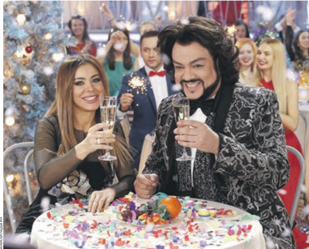
12 декабря 2015 года 19:58 Ани Лорак и Филипп Киркоров записывают очередной дубль новогоднего поздравления, которое мы увидим в ночь на 1 января

ОКСАНА ПОЛЯКОВА из павильона «Мосфильма»