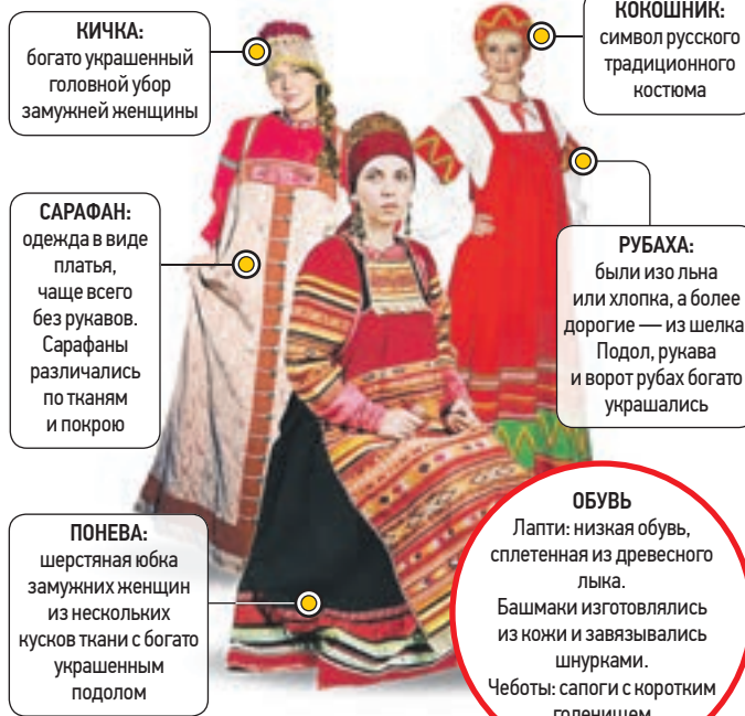
О МОДЕ С НАЦИОНАЛЬНЫМ КОЛОРИТОМ → стр. 3

Его отличают многосоставность, богатство отделки и простой, прямой или слегка расклешенный силуэт. Расцветка народного костюма в основном яркая и радостная.