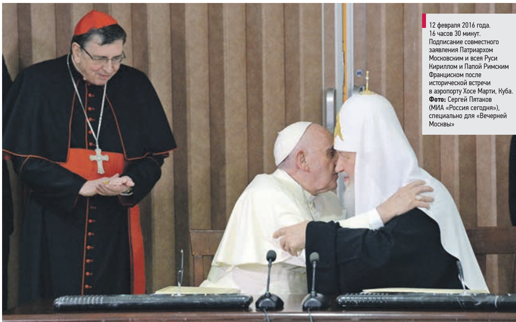
12 февраля 2016 года. 16 часов 30 минут. Подписание совместного заявления Патриархом Московским и всея Руси Кириллом и Папой Римским Франциском после исторической встречи в аэропорту Хосе Марти, Куба.