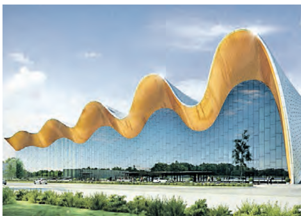
► Визуализация Центра художественной гимнастики в олимпийском комплексе «Лужники»

Центр художественной гимнастики строят по уникальному проекту. Конструкция крыши будет выполнена в форме развевающейся гимнастической ленты.