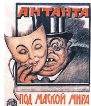
Российская государственная библиотека

До 27 ноября в читальном зале можно познакомиться с самыми яркими плакатами прошлого века.