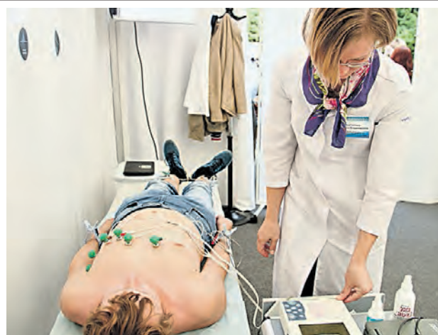
▶ 2 сентября 2017 года. Первый этап акции «Пульс города»

первичный осмотр пациентов и давать рекомендации с 12:00 до 20:00. В рамках акции в студии телеканала «Москва 24» соберется профессиональный медицинский совет, который в режиме реального времени поможет врачам