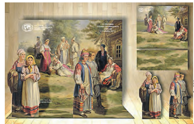
▶ Визуализация селфи-зоны, которая появилась на Ярославском вокзале

На Ярославском вокзале появилась селфи-зона по мотивам этнографического альбома XIX века Густава Паули. В зале ожидания накануне фестиваля Русского географического общества установили фигуры, изображающие жителей разных губерний в национальных костюмах.