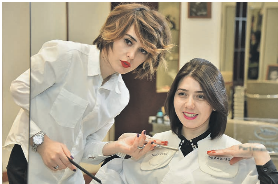
Короткие стрижки, пикси, челки «шторкой» и укладки с мокрым эффектом также останутся популярными