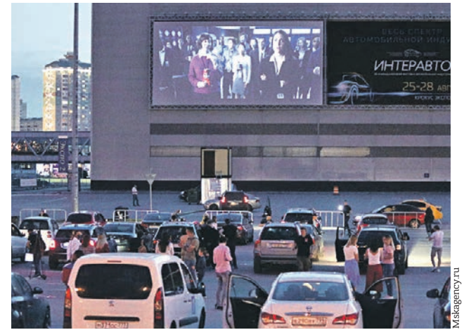
11 июня 2020 года. Первый автокинотеатр в Москве заработал в «Крокус Сити»