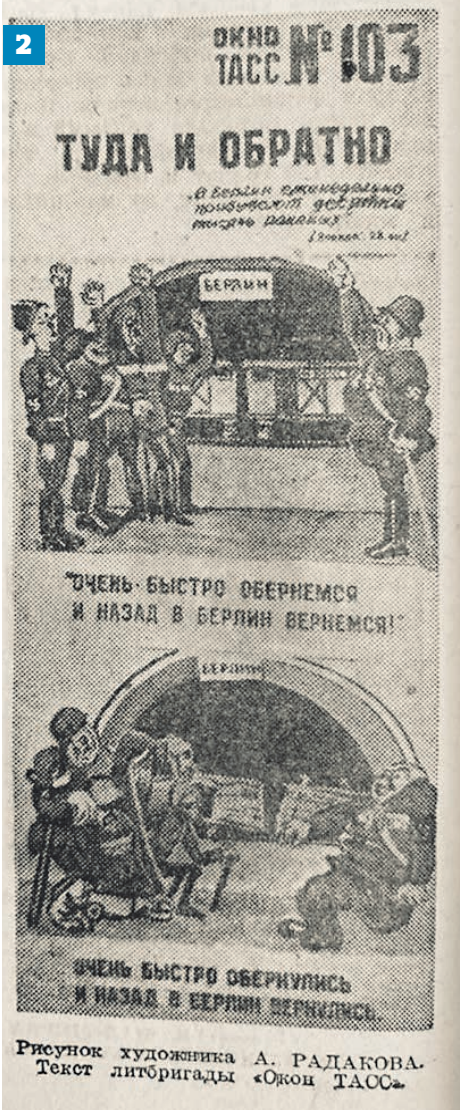
Рисунок художника А. РАДКОВА. Текст литбригады «Окно ТАСС».