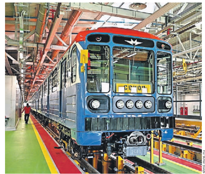
10 апреля 2021 года. Новый пусковой комплекс электродепо «Сокол»