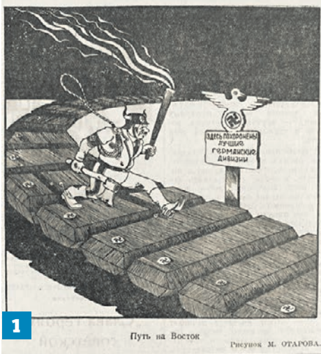
1 Путь на Восток. Рисунок М. ОТАРОВА.

В годы Великой Отечественной войны искусство агитплаката, графики и сатиры приобрело особое звучание. «Вечерка» публикует восемь карикатур, которые были напечатаны в ее номерах в самый тяжелый период борьбы с фашизмом — летом и осенью 1941 года.