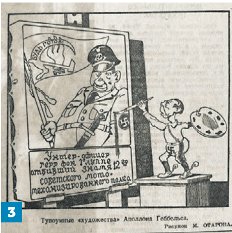
3 Тупоумные «художества» Аполлона Геббельса. Рисунок М. ОТАРОВА.