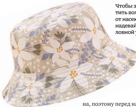
Чтобы защитить волосы от насекомых, надевайте головной убор

этого необходимо в первую очередь правильно одеться. — Желательно, чтобы ваша экипировка была светлой — это позволит увидеть еще ползущего клеща, — рассказывает специалист. — Брюки нужно заправить в сапоги или высокие ботинки, в крайнем случае — в носки. Любой головной убор тоже не будет лишним. Не стоит пренебрегать и противоклещевыми, или акарицидными средствами.