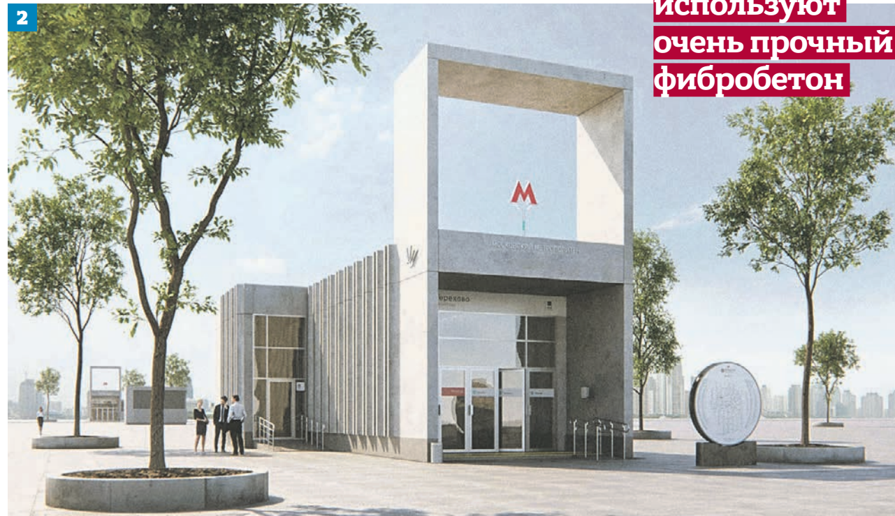
Визуализация будущих станций западного участка Большой кольцевой линии: вид на платформу «Кунцевская» (1) и входная группа станции «Терехово» (2)

Станция «Терехово» возводится в Мневниковской пойме. Бетонирование завершено более чем на 90 процентов. Зайствованы около 600 человек, более 12,5 тысячи единиц техники. Отделка выполнена на 85 процентов. Ведущая роль отводится организации освещения