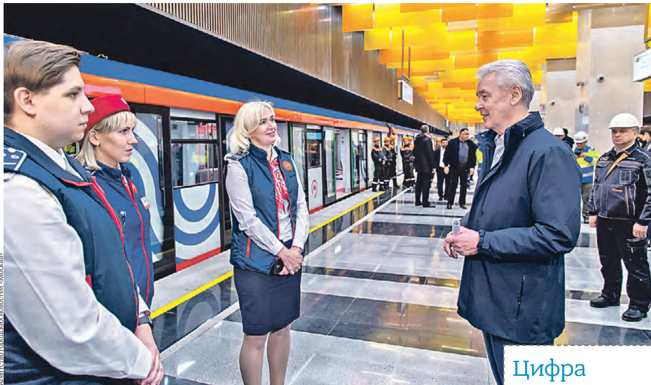
Мэр Москвы Сергей Собянин (справа) провел технический пуск южного участка Большой кольцевой линии метро