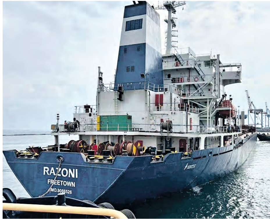
1 августа 2022 года. Сухогруз Razoni в порту Одессы: в Черное море вышло первое судно в рамках «зерновой сделки»

Россия отказалась сотрудничать с Западом