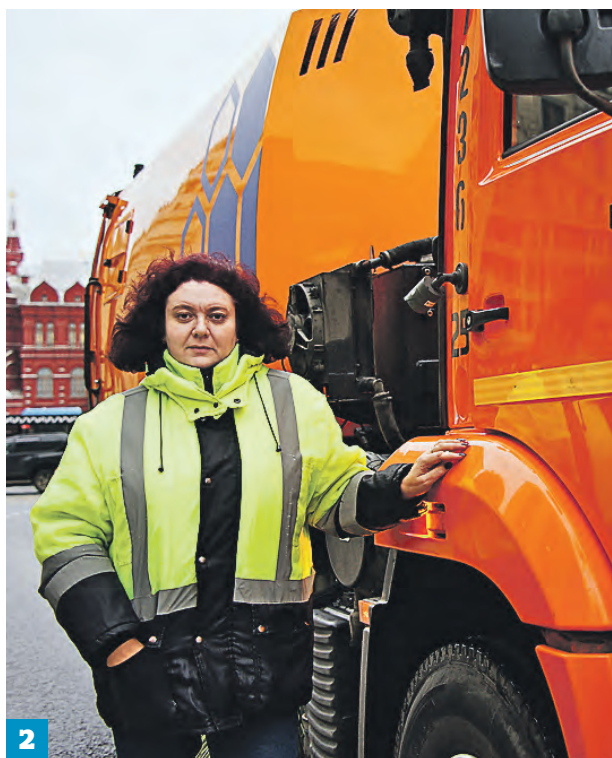
2 сказал заместитель мэра столицы по вопросам жилищно-коммунального хозяйства и благоустройства

В ведомстве добавили, что выборочную обработку провели и в особо опасных для движения местах — на мостах, эстакадах, тоннелях, крутых подъемах и спусках. Оперативно городские службы стали убирать и поваленные деревья. Коммунальщики просят не парковать машины под деревьями или шаткими конструкциями. В дополнение к снегу в Москве был еще и сильный ветер. Временами его порывы превышали 18–20 метров в секунду.