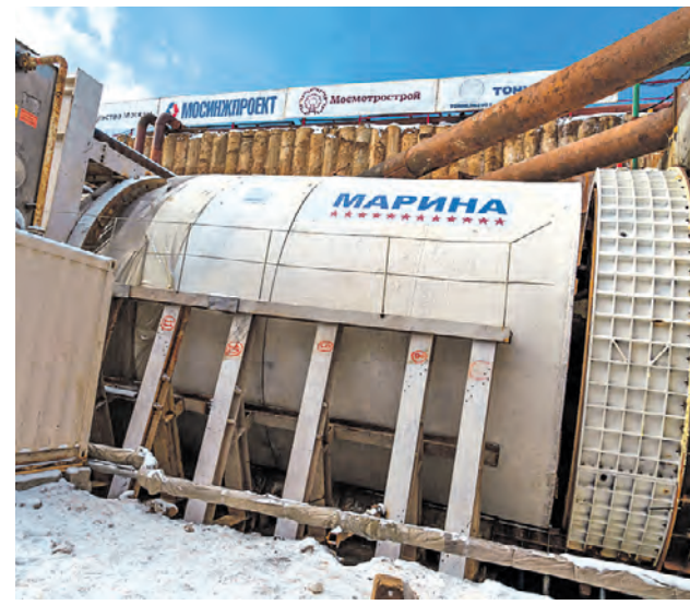
Старт проходки левого перегонного тоннеля между станциями «Вавиловская» и «Академическая»