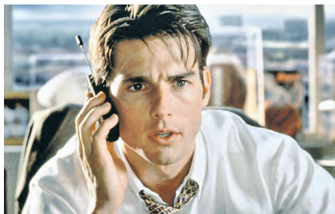
Кадр из фильма «Джерри Магуайер» (1996): Том Круз в роли спортивного агента по имени Джерри

Эти картины сложно найти. Важно сохранять такие вещи. Сейчас многие стали гоняться за арт-хаусом. Если спросить молодежь о любимых фильмах, они, скорее всего, назовут те, которые им кто-то подсказал из окружения — мол, это модное кино, о нем говорят. А если я скажу, что мои любимые фильмы — это «Крестный отец», «Сердце Ангела», «Джерри Магуайер», «Храброе сердце», они могут и не понять, о чем я. Думаю, мы сейчас стали путать моду и то, что нам правда нравится, стали менее искренними. Есть гениальный фильм — «Дневная красавица» Луиса Бунюэля. Но о нем никто не вспоминает — разве что киноманы или киноведы.