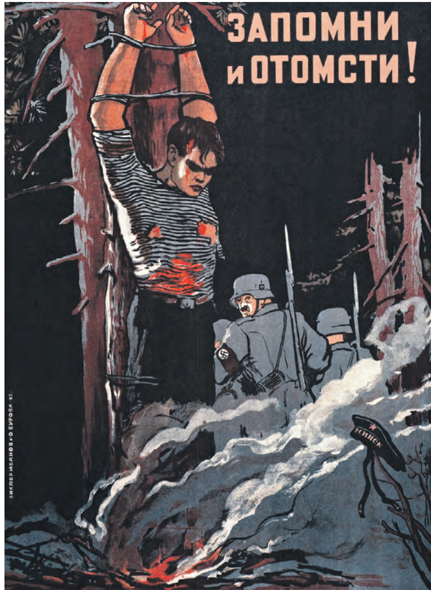
ФАШИСТСКИЕ ЗВЕРИ ЗАМУЧИЛИ И СОЖЛИ КРАСНОФЛОТЦА С „МИНСКА“. МОРЯКИ! ОТОМСТИМ ЗА СМЕРТЬ ТОВАРИЩА! НИКАКОЙ ПОЩАДЫ НЕМЕЦКИМ БАНДИТАМ!